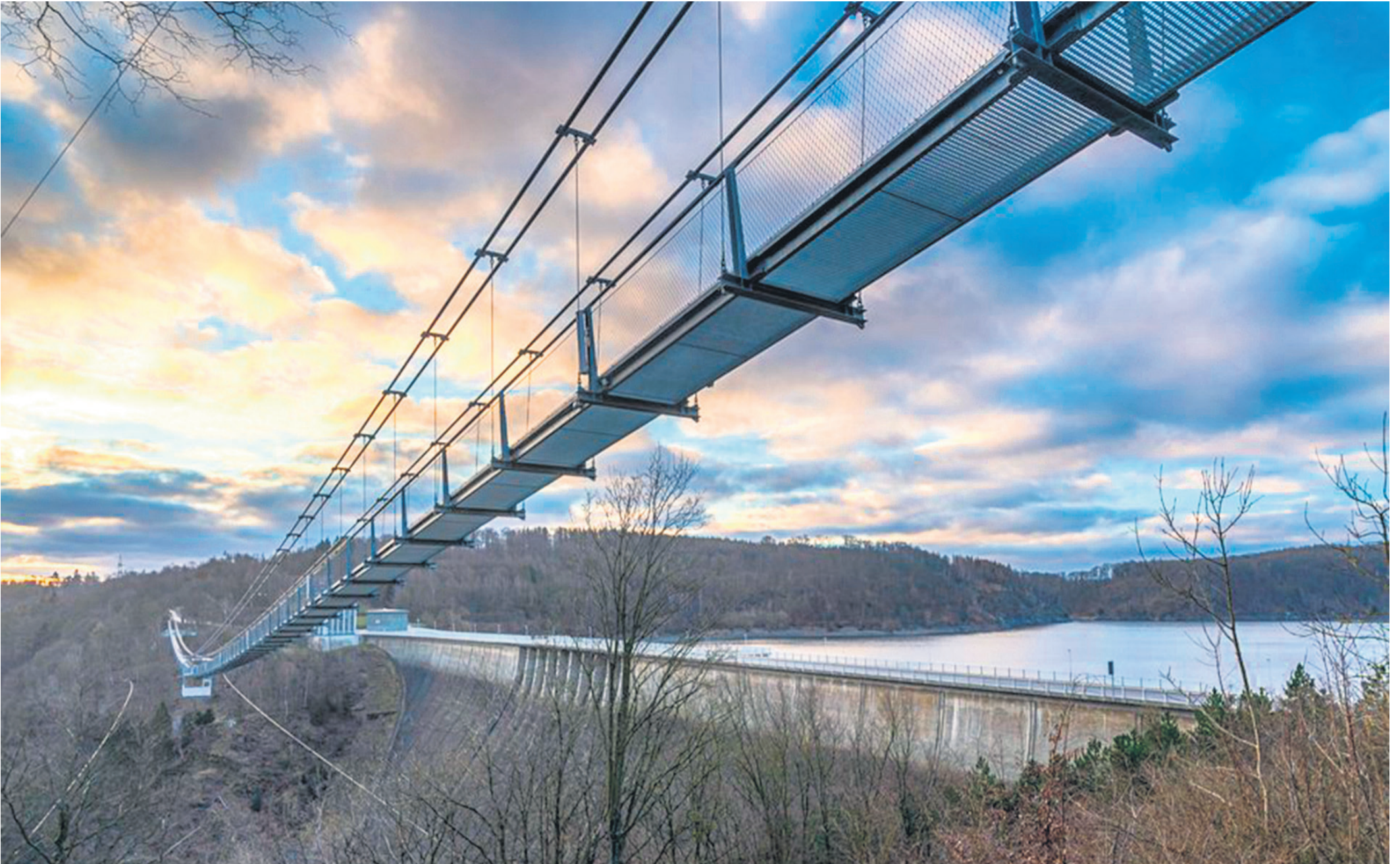
Hoch über dem Rappbodetal lädt die Hängebrücke Titan RT zum 450 Meter langen, schwankenden Übergang ein.