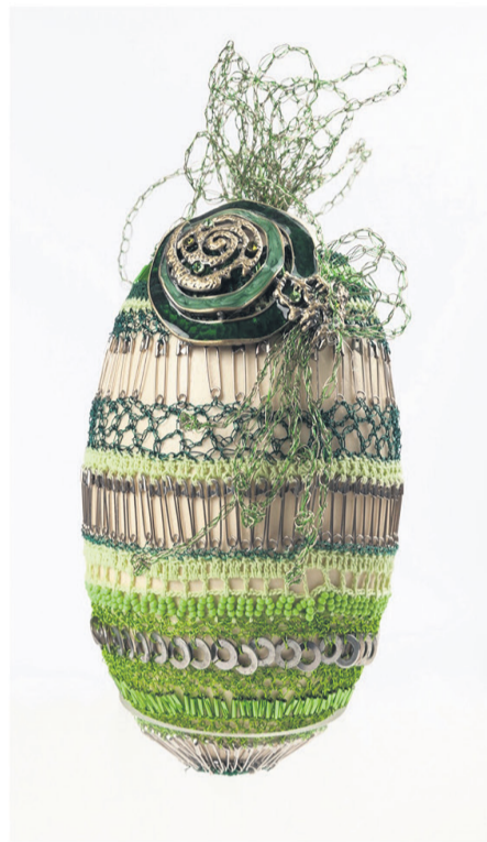
Grönland "Irische Impressionen"