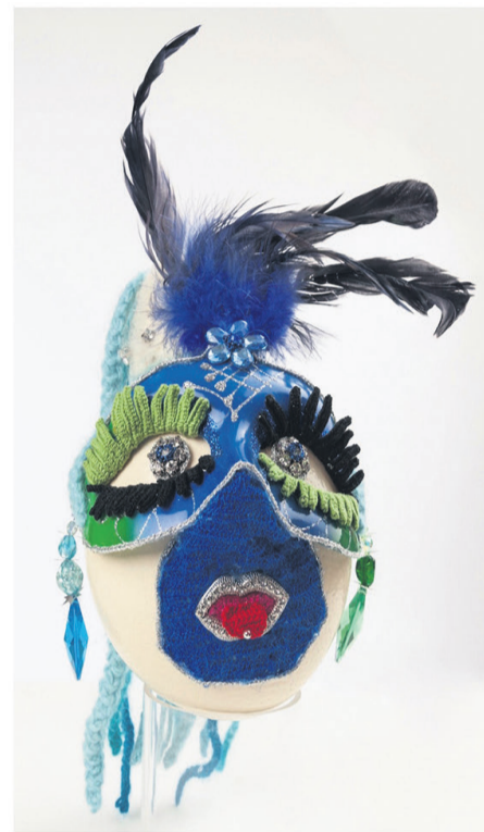
Venezia - Karneval in Venedig