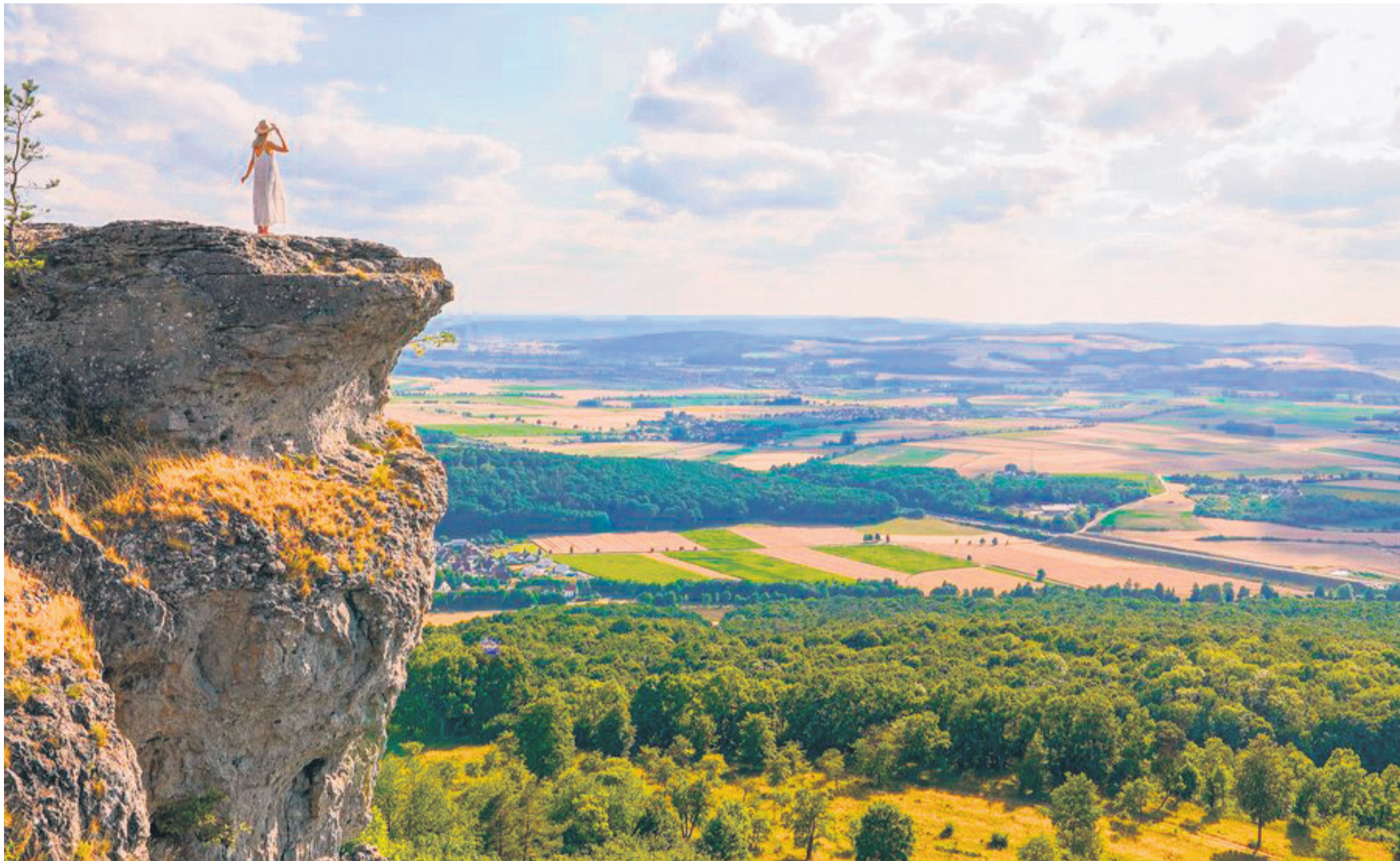
Auf dem Staffelberg kann man nicht nur in die Ferne schauen, sondern auch in alte Bräuche und Geschichten eintauchen.