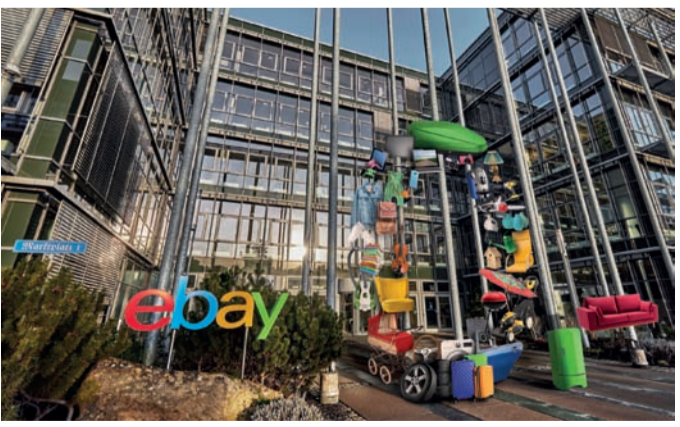
*Repräsentative Online-Umfrage der YouGov Deutschland GmbH für eBay Deutschland, Januar 2023, Stichprobengröße: 2.042 Teilnehmende in Deutschland

Was sich bei eBay.de nicht ändert: Die sichere, integrierte und ebenfalls kostenlose Zahlungsabwicklung ohne Weitergabe von Bankdaten an Dritte garantiert, dass ein Artikel erst versendet wird, wenn