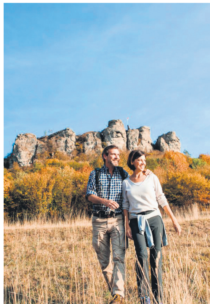
Verschiedene Wanderwege führen auf den Staffelberg mit seinem felsbekränzten Hochplateau.