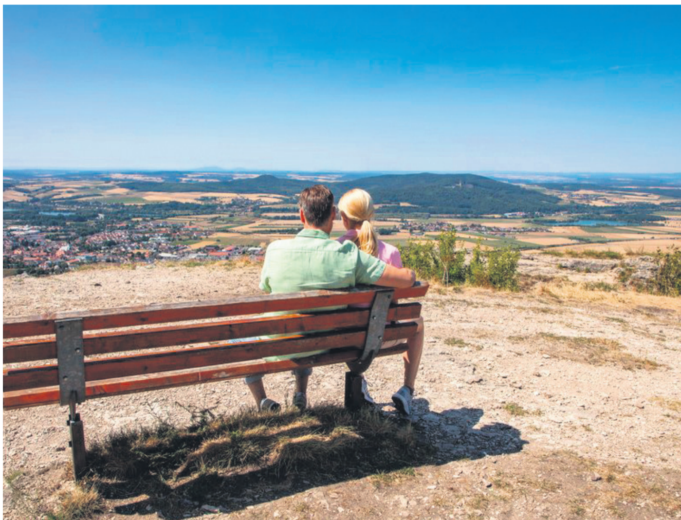
Der weite Blick über das Maintal ist die Belohnung für den Aufstieg

sicht „von Bamberg bis zum Grabfeldgau“. An klaren Tagen sind sogar der Rennsteig, die Veste Coburg und der Frankenwald zu sehen. Ausklingen lassen kann man den Ausflug mit einer Einkehr in die Staffelbergklause. Bei einer leckeren Brotzeit und einem kühlen Bier werden dann Pläne für den nächsten Tag geschmiedet – etwa für einen Besuch des Klosters Banz, der Basilika Vierzehnheiligen oder für einen Wellness-Tag in der Obermain Therme.