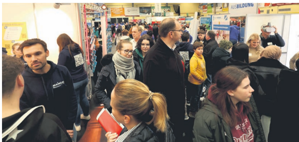
In der Sporthalle Wiesbadener Straße und in der benachbarten Heinrich-Böll-Schule herrschte am Samstag Hochbetrieb.

Nieder-Roden (PS) - Die Bildungsmesse Rodgau fand am Samstag bereits zum 27. Mal statt. In den vergangenen Jahren wurde auch bei den Ausstellern in Nieder-Roden ein Wandel deutlich sichtbar: Die Zeiten von Lehrstellenmangel und einer hohen Jugendarbeitslosigkeit sind längst vorbei, heute sind in den Betrieben noch viele Ausbildungsplätze frei.