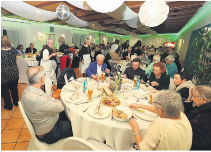
Erstmals seit 2020 konnte das Heringessen wieder stattfinden.