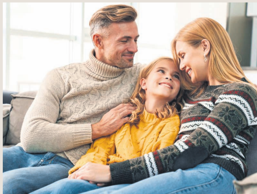
Zuhause wohlfühlen und gleichzeitig Energiekosten sparen: Wohnungslüftung mit Wärmerückgewinnung sorgt für frische Luft, ohne dass ein Fenster geöffnet werden muss.