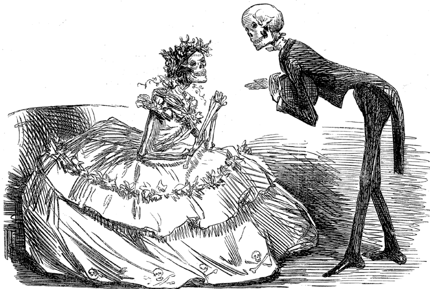
THE ARSENIC WALTZ.

THE NEW DANCE OF DEATH. (DEDICATED TO THE GREEN WREATH AND DRESS-MONGERS.)