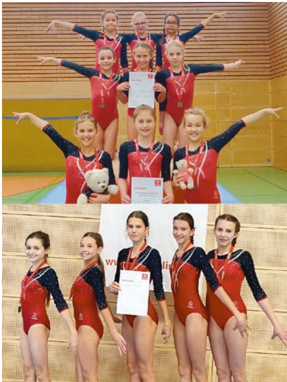
Die Mädels freuen sich über die Ränge 4, 6 und 7