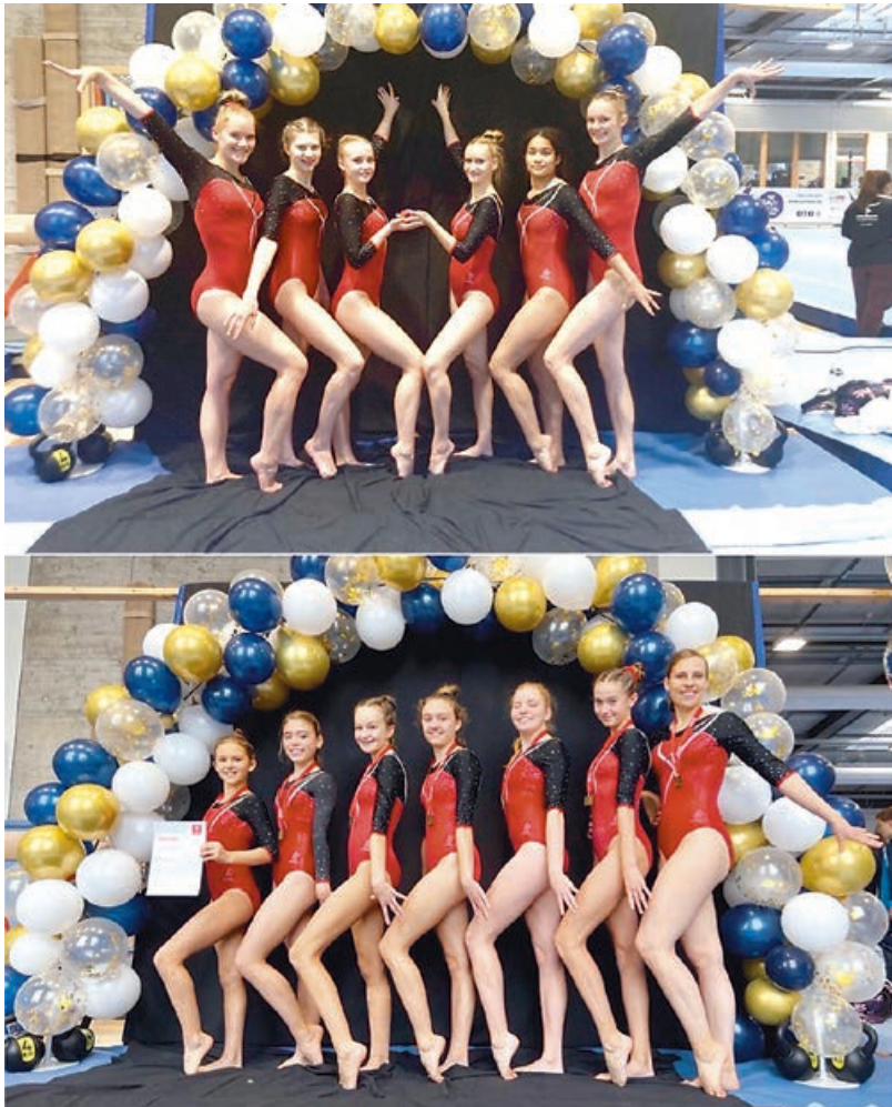
Unsere beiden Landesligamannschaften

verzeichnen konnte. Mit einem 4. Platz in der Tageswertung und dem daraus resultierenden 5. Rang in der Gesamtwertung gelang dem Team damit der Klassenerhalt.