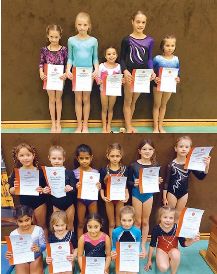
Unsere Nachwuchsturnerinnen der Jahrgänge 2011 - 2016