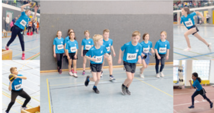
Die TSG Athleten in neuer Wettkampfkleidung.

(Wixhausen, IST) Am Sonntag, den 5.3.23, nahmen nun auch die Leichtathletik-Kinder in der Altersklasse U12 an den Wettkämpfen im Sprint, Hürdenlauf, Weitsprung, Hochsprung und Medizinball-Stoßen teil.