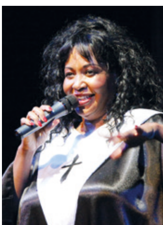
(Erzhausen, KT) Musik für die Seele im Bürgerhaus Erzhausen: Am 2. April 2023 lädt der bekannte Chor Blue Lights