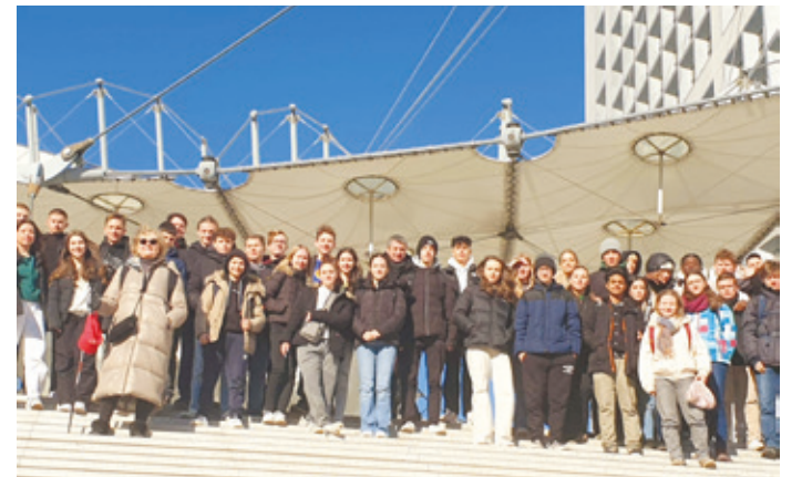
Auf den Stufen zu La Defense, dem modernen Paris, das in der Mitterrand-Ara entstand.

und entwickelten viele Ideen für die Zukunft. Die Hessenwaldschüler*innen schlagen beispielsweise vor, sie in die Arbeit der Partnerschaftsgremien einzubeziehen, wünschen sich gemeinsame Kunstprojekte und Ausflüge. Die Lernenden der 10e sind dabei ein Konzept zur Einbindung der Jugendlichen in die Partnerschaften mit Verneuil und der italienischen Partnerstadt Weiterstadts