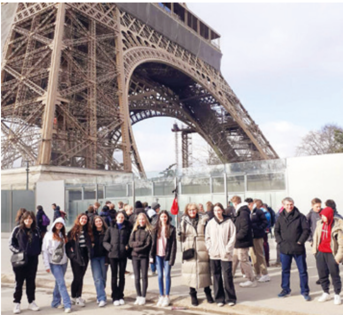
Den Eiffelturm bewunderten die Erasmus-Schüler*innen aus dem Hessenwald.

(Weiterstadt, STI/LÖR) „Wie können wir Jugendliche uns in die Städtepartnerschaften einbringen?“ Diese Frage stellten sich die Schüler*innen der Klassen 9e und 10e vor und während einer Erasmus-Begegnung in Weiterstadts Partnerstadt Verneuil-sur-Seine. Gemeinsam mit Schüler*innen der beiden Schulen „Collège Jean Zay“ und „Collège Notre Dame les Oiseaux“ suchten sie Antworten auf diese Frage