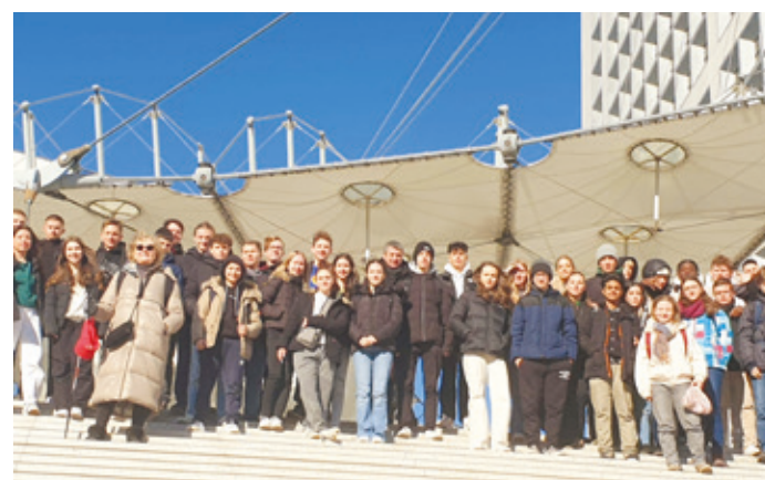
Auf den Stufen zu La Défense, dem modernen Paris, das in der Mitterand-Ära entstand.

und entwickelten viele Ideen für die Zukunft. Die Hessenwaldschüler*innen schlugen beispielsweise vor, sie in die Arbeit der Partnerschaftsgremien einzubeziehen, wünschen sich gemeinsame Kunstprojekte und Ausflüge. Die Lernenden der 10e sind dabei ein Konzept zur Einbindung der Jugendlichen in die Partnerschaften mit Verneuil und der italienischen Partnerstadt Weiterstadt's