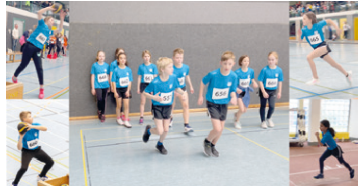
Die TSG Athleten in neuer Wettkampfkleidung.

Erfolgreiche Teilnahme an den Kreis-Hallenmeisterschaften U12