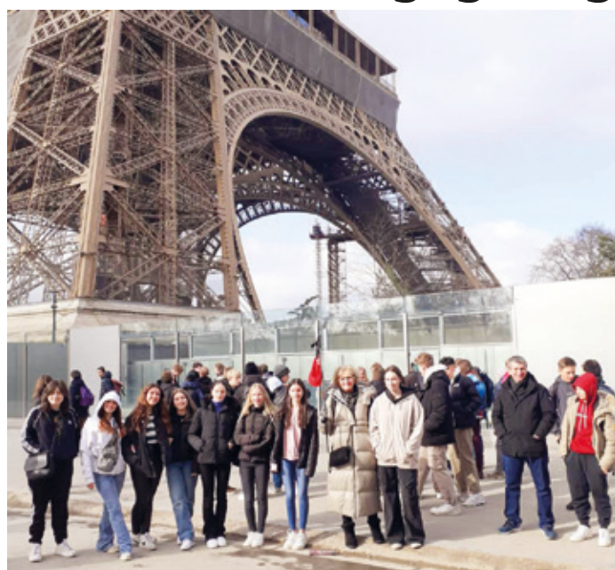
Den Eiffelturm bewunderten die Erasmus-Schüler*innen aus dem Hessenwald.

(Weiterstadt, STI/LÖR) „Wie können wir Jugendliche uns in die Städtepartnerschaften einbringen?“ Diese Frage stellten sich die Schüler*innen der Klassen 9e und 10e vor und während einer Erasmus-Begegnung in Weiterstadt's Partnerstadt Verneuil-sur-Seine. Gemeinsam mit Schüler*innen der beiden Schulen „Collège Jean Zay“ und „Collège Notre Dame les Oiseaux“ suchten sie Antworten auf diese Frage