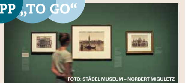
Ausstellungsansicht „Italien vor Augen. Frühe Fotografien ewiger Sehnsuchtsorte“.