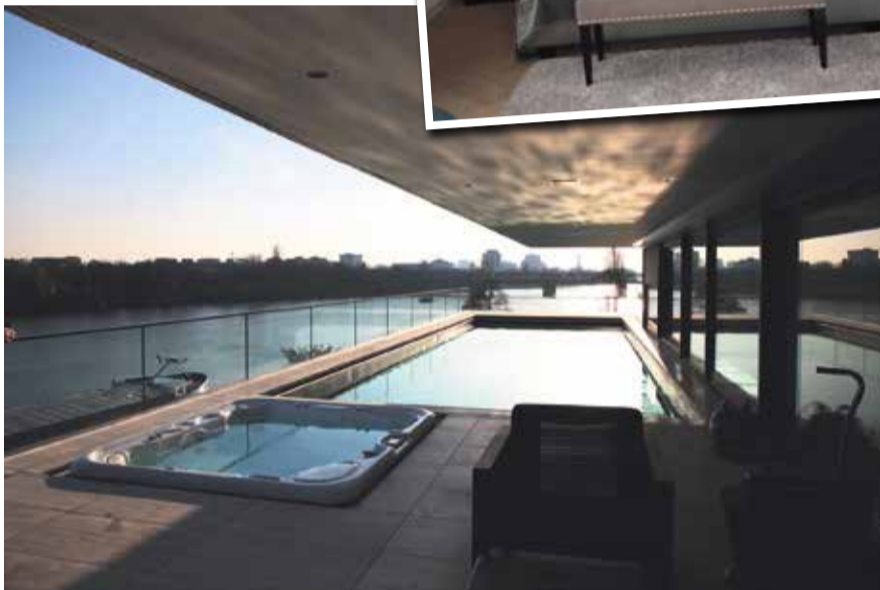
Fotoimpressionen vom Presserundgang.