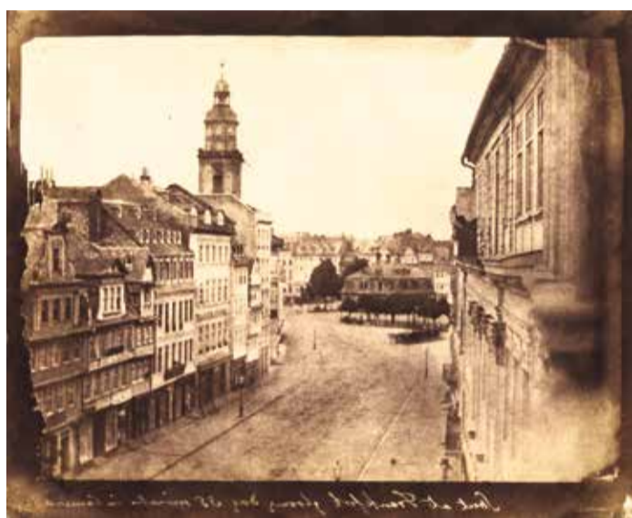
Blick aus einem Fenster des Hotels „Russischer Hof“ auf der Zeil nach Westen zur Hauptwache, Salzpapierabzug von einer Kalotypie von William Henry Fox Talbot (1800-1877)

Kontakt zu „Gut Geht's“ gibt es per E-Mail an gutgehts@stadt-frankfurt.de.