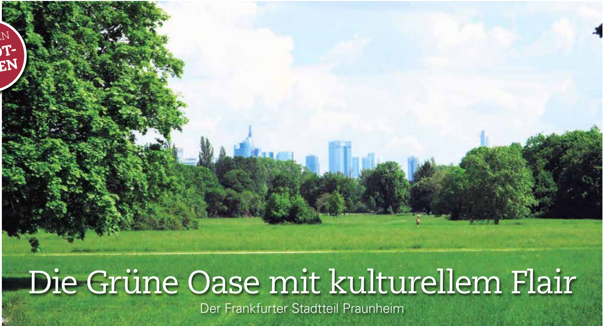
Der Niddapark mit Blick in Richtung Innenstadt