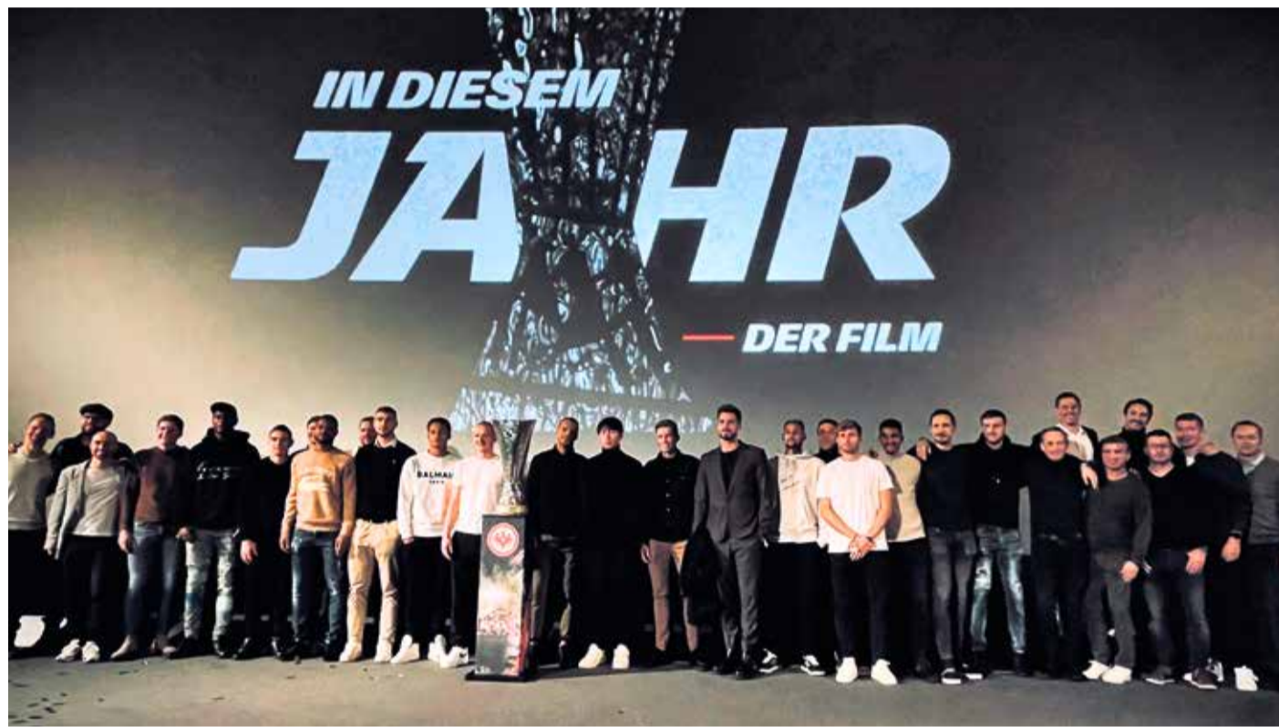
Die Europapokalhelden bei der Film Premiere am Eintracht-Geburtstag im Metropolis

Eintracht Frankfurts Europapokalmärchen bald im Kino