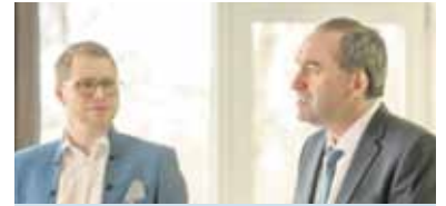
Hubert Aiwanger stellte sich den durchaus kritischen Fragen und sicherte den unabhängigen Medien seine Unterstützung zu.