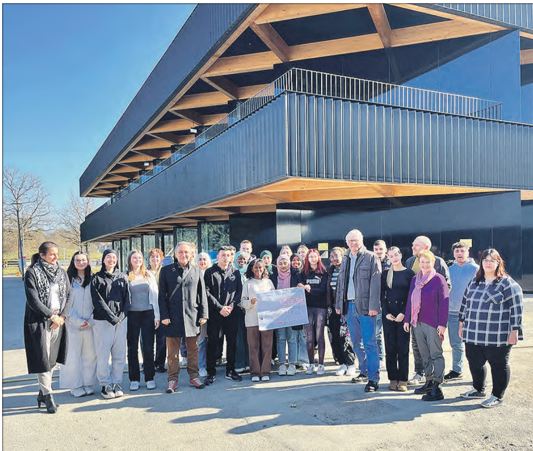
GRUPPENFOTO MIT SPENDENSHECK vor der Heinrich-Emanuel-Merck-Schule.