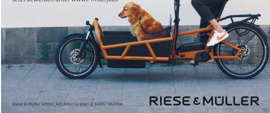
Riese & Müller GmbH, Am Alten Graben 2, 64367 Mühlthal