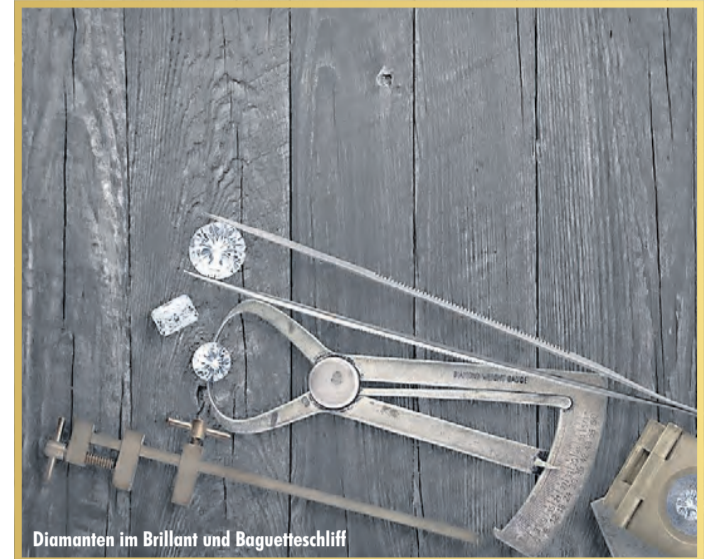
Diamanten im Brillant und Baguetteschliff

ten vorzulegen. Laut Experten kann beispielsweise eine Rolex GMT Master aus den 70er Jahren bis zu 9.000 EUR erzielen. Des Weiteren bieten die Experten von »Bares für Wa(h)res« kostenlose Wertschätzung von Diamanten an. Besonders interessant sind Diamanten im Brillant-Schliff ab einer Größe von 0,50 Carat. Hier gilt immer die Faustregel: ein einzelner großer Diamant ist wertvoller als viele kleine Diamanten. Ein Besuch bei den Experten lohnt sich in jedem Fall, denn hier wird Ihr Schatz professionell taxiert und zu einem fairen Preis entgegen genommen.