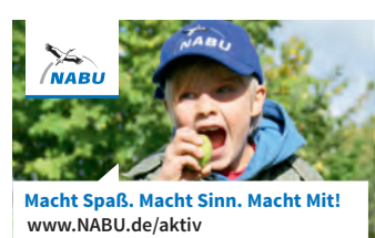
Macht Spaß. Macht Sinn. Macht Mit! www.NABU.de/aktiv