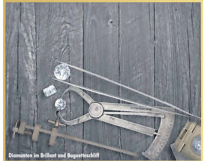
Diamanten im Brillant und Baguette-Schliff

ten vorzulegen. Laut Experten kann beispielsweise eine Rolex GMT Master aus den 70er Jahren bis zu 9.000 EUR erzielen. Des Weiteren bieten die Experten von »Bares für Wa(h)res« kostenlose Wertschätzung von Diamanten an. Besonders interessant sind Diamanten im Brillant-Schliff ab einer Größe von 0,50 Carat. Hier gilt immer die Faustregel: ein einzelner großer Diamant ist wertvoller als viele kleine Diamanten. Ein Besuch bei den Experten lohnt sich in jedem Fall, denn hier wird Ihr Schatz professionell taxiert und zu einem fairen Preis entgegen genommen.