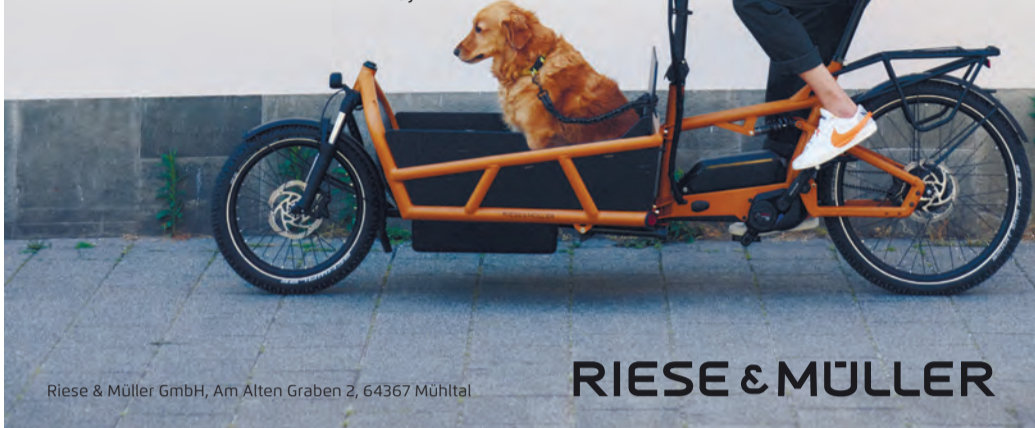
Riese & Müller GmbH, Am Alten Graben 2, 64367 Mühlthal