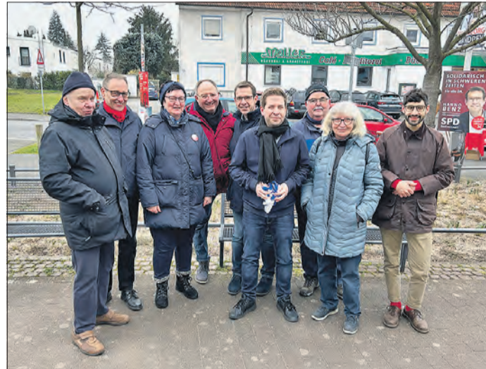
GRUPPENFOTO mit Kevin Kühnert