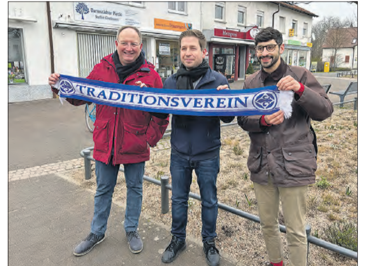
SYMPATHIE für die Lilien.