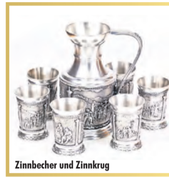
Zinnbecher und Zinnkrug

Goldhaus Darmstadt Ernst-Ludwig-Straße 20-22 (gegenüber Deichmann) 64283 Darmstadt Telefon: 061 51/501 07 86 Aktionszeitraum vom 13.03. – 18.03.2023