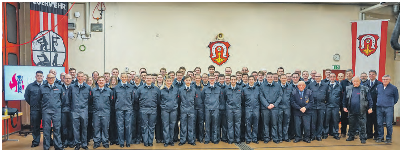
DIE MITGLIEDER der Freiwilligen Feuerwehr Griesheim.

Mitglieder während der Jahreshauptversammlung geehrt