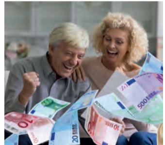
Es geht um viel Geld.

Bei einem Widerruf erhalten Sie – anders als bei der Kündigung – alle eingezahlten Beiträge ohne Abzug von Maklerprovisionen und Verwaltungskosten zurück. Und nicht nur das: Die Versicherung muss Sie auch an dem mit Ihrem Geld erzielten Anlagegewinn beteiligen. So können Sie bis zu 150 % der eingezahlten Beiträge zurückholen. Ein sattes Plus auf Ihrem Konto winkt!