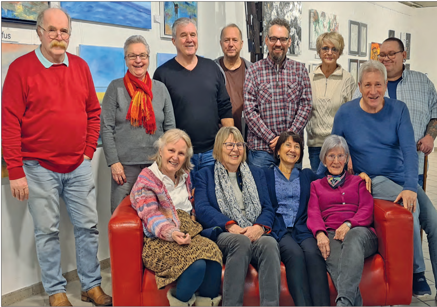
Kreatives Gruppenfoto: Die KiB-Künstler aus der Region.