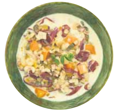
Rezepttipp 2: Bündner Gerstensuppe

Zwiebel und Ingwer in den Topf geben, auf höchster Stufe bis zum Secuquick softline Bratfenster aufheizen, auf niedrige Stufe schalten, Knollensellerie und Karotten hinzugeben und unter Rühren anbraten. Mit Reiswein und Hühnerbrühe ablöschen, die Hähnchenbrust zugeben. Herd auf höchster Stufe bis zum Secuquick softline Gemüsefenster aufheizen, auf niedrige Stufe schalten und circa 10 Minuten im Gemüsebereich garen. Frühlingszwiebeln zugeben, mit Salz und Szechuan-Pfeffer abschmecken.