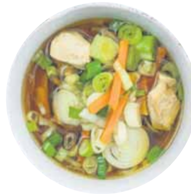
Rezepttipp 1: Asiatische Hühnersuppe