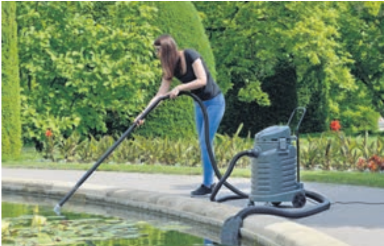
Mit einem Schlammsauger lässt sich abgelagerte Biomasse aus Pflanzenresten und Schlamm vom Boden absaugen.