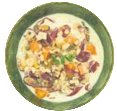
Rezepttipp 2: Bündner Gerstensuppe

Zwiebel und Ingwer in den Topf geben, auf höchster Stufe bis zum Secuquick softline Bratfenster aufheizen, auf niedrige Stufe schalten, Knollensellerie und Karotten hinzugeben und unter Rühren anbraten. Mit Reiswein und Hühnerbrühe ablöschen, die Hähnchenbrust zugeben. Herd auf höchster Stufe bis zum Secuquick softline Gemüsefenster aufheizen, auf niedrige Stufe schalten und circa 10 Minuten im Gemüsebereich garen. Frühlingszwiebeln zugeben, mit Salz und Szechuan-Pfeffer abschmecken.