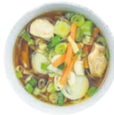
Rezepttipp 1: Asiatische Hühnersuppe

Zwiebel, Karotten und Knollensellerie schälen beziehungsweise putzen und in Würfel schneiden. Lauch putzen und in Scheiben schneiden. Alles mit Majoran, Speckwürfeln, Gerstengraupen und Fleischbrühe im Topf mischen. Secuquick softline aufsetzen und verschließen. Topf auf höchster Stufe bis zum Turbo-Fenster aufheizen, auf niedrige Stufe schalten und circa 20 Minuten im Turbo-Bereich kochen. Secuquick nach Ende der Kochzeit drucklos machen und abnehmen. Majoran herausnehmen. Bündner Fleisch in feine Streifen schneiden und mit der Sahne unterrühren. Mit Salz und Pfeffer abschmecken.