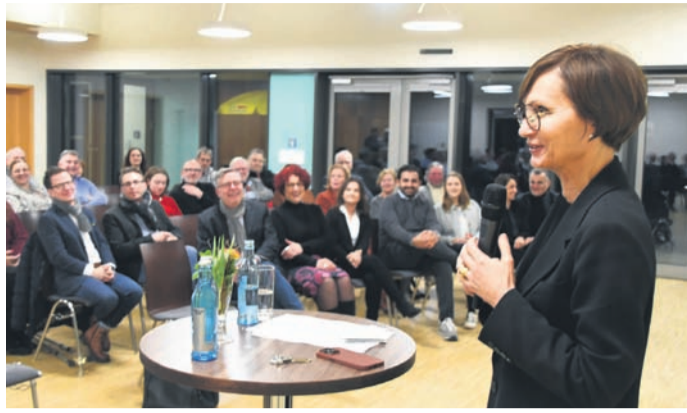
„Bildung ist für junge Menschen das Tor zur Welt“: Bettina Stark-Watzinger in Eppertshausen.

Bettina Stark-Watzinger, Bundesministerin für Bildung und Forschung, wirbt beim Frühlingsempfang der FDP Münster und Eppertshausen für Vielfalt im System