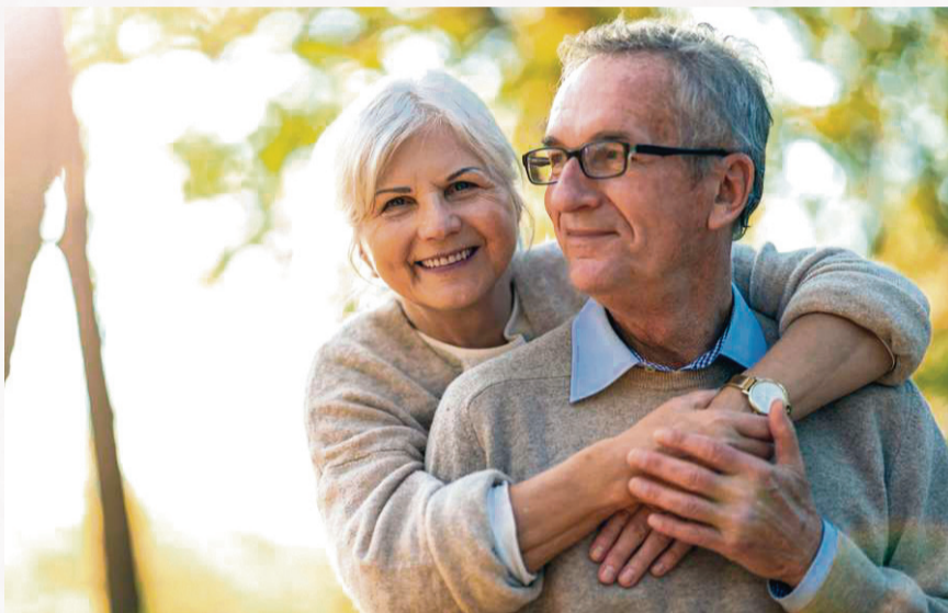
Viele Menschen bevorzugen individuelle Bestattungsformen und bestimmen bereits zu Lebzeiten das Prozedere für ihren letzten Gang.

stattung. Mit der Tendenz zur Urnenbestattung verbunden ist die wachsende Nachfrage nach alternativen und individuellen Bestattungsformen wie dem Friedwald, der Seebestattung oder dem Erinnerungsdiamanten.