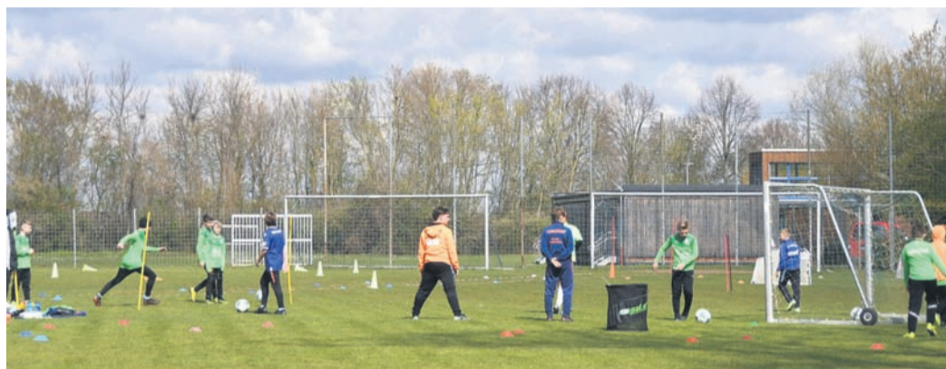
Der TSV Altheim verfügt über ein Sportgelände mit zwei Naturrasen-Großfeldern (hier der Trainingsplatz), einen Biergarten und ein Vereinsheim und nutzt dazu die benachbarte Sport- und Kulturhalle. Personell hängt die Zukunft des Turn- und Sportvereins aber weiter am seidenen Faden.