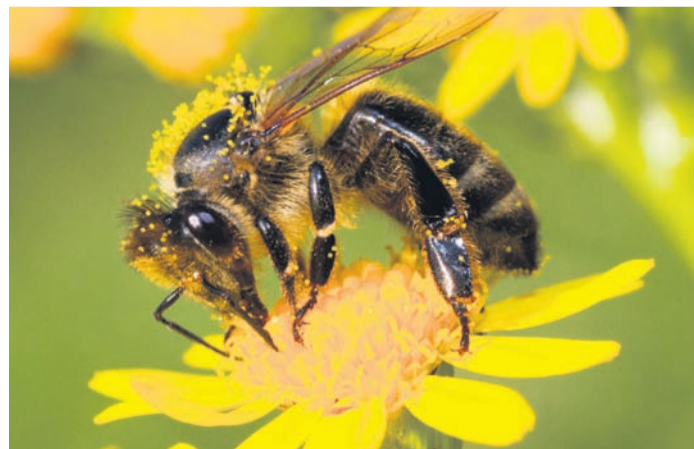
Krainer Biene labt sich am Jakobsgraskraut.

Wasser. Vögel trinken und baden gerne in den am Baum aufgehängten Tränken (der Fachhandel bietet verschiedene Artikel an), für Säugetiere steht die Wasserquelle auf dem Boden. Die Trinkgefäße sind täglich zu reinigen. Der Blick des Gartenbesitzers kann schon jetzt zwölf Monate in die Zukunft gehen: Für das nächste zeitige Frühjahr sind Frühblüher im Garten dekorativ: Leberblümchen, Märzenbecher, Narzisse, Scharbockskraut, Winterling und Blaustern bilden Pollen, wenn die ersten Insekten nach der Winterruhe auf Erkundungsflug gehen. Hummeln frischen die Nahrungsreserven schon zeitig im Jahr gerne an der Salweide und der Kornelkirsche auf.