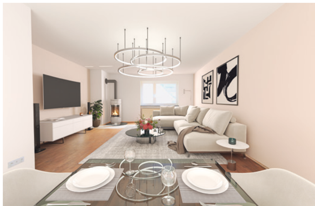
Nach der virtuellen Visualisierung.

Viele Eigentümer setzen gerade jetzt auf die Vermarktung mit einem