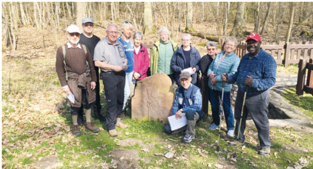
Ein Bild von der Mittagspause der Fußwallfahrer am Jakobsbrunnen.