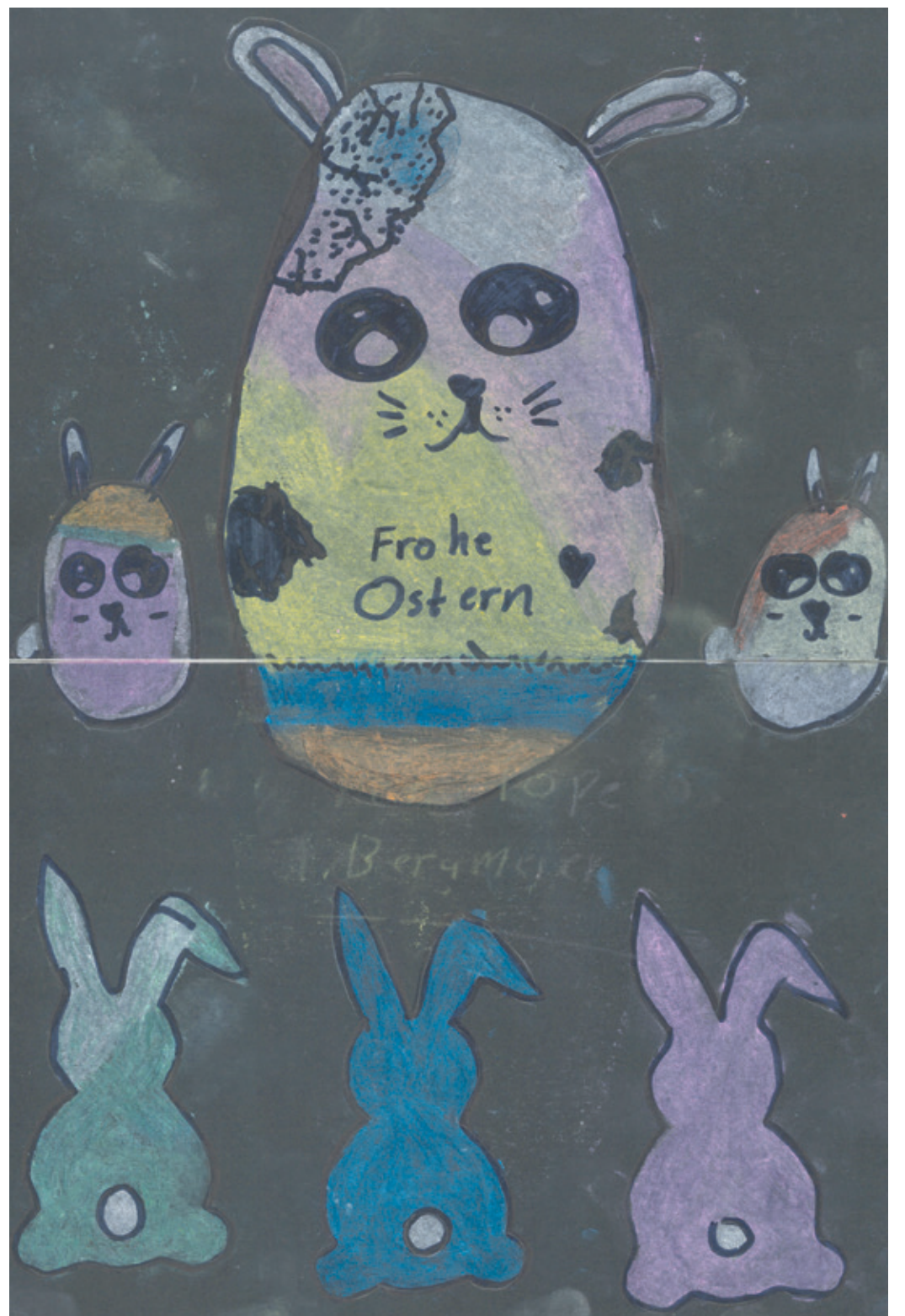
Penélope aus Darmstadt.