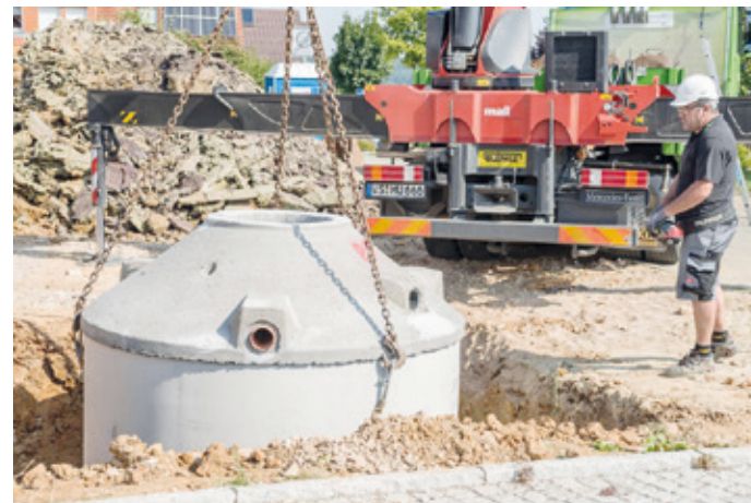
Eine Betonzisterne wird per Kran in die vorbereitete Garten-grube eingelassen.

(DJD) Das Trinkwasser ist in den vergangenen drei Jahren stetig teurer geworden. Den größten Anteil der kostbaren Flüssigkeit verbrauchen die Deutschen laut Statista beim Baden und Duschen, gefolgt von der Toilettenspülung und dem Wäschewaschen. Genau hier liegt ein nennenswertes Sparpotenzial, denn gerade Toilette und Waschmaschine müssen nicht mit teurem Trinkwasser betrieben werden. Dafür reicht die Versorgung mit Regenwasser. Auch für die Gartenbewässerung oder Reinigungsarbeiten am Haus können Hausbewohner das kostenlose Nass von oben nutzen. Dieses lässt sich beispielsweise in einer unterirdischen