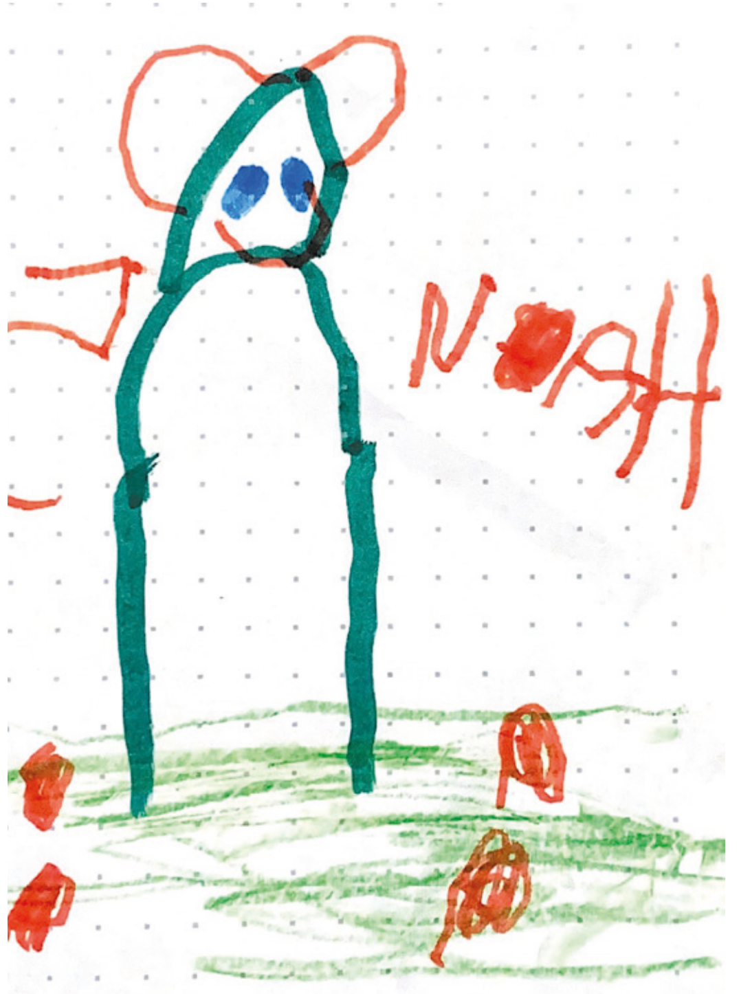
Noah, 5 Jahre alt aus Kranichstein.