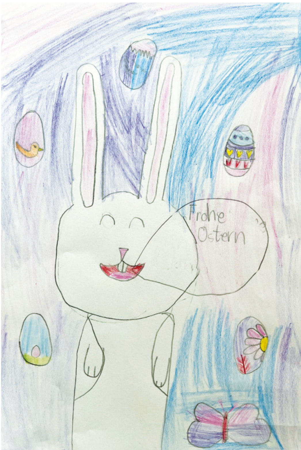
Elin, 8 Jahre alt aus Arheilgen.