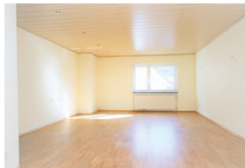
Vor der virtuellen Visualisierung.

Um Ihre Immobilie bestmöglich am Markt zu platzieren, inserieren wir in hoch frequentierten Immobilienportalen und schicken das Angebot an die passenden Suchinteressenten aus unserer Datenbank.