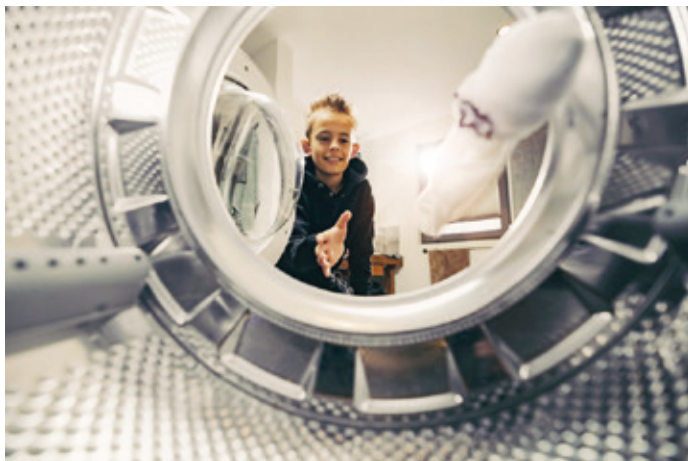
Um dreckige Wäsche sauber zu kriegen, kann man die Waschmaschine auch mit Regenwasser betreiben.

Gesammeltes Wasser aus der Zisterne für Toilette und Waschmaschine nutzen