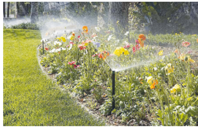
Automatische Bewässerungssysteme dosieren das Nass effektiver und sparsamer als der Mensch.

(djd) Das Frühjahr beginnt gefühlt immer zeitiger und der Sommer ist tendenziell heißer und trockener. Aufmerksame Gartenbesitzer spüren diese klimatischen Veränderungen bereits seit geraumer Zeit. Mit langandauernden Dürrephasen steigt der Pflegeaufwand, den das heimische Grün erfordert. Das Wässern per Hand ist nicht nur lästig und zeitaufwendig, sondern auch wenig effektiv. Komfortabler und gleichzeitig sparsamer lassen sich Rasenflächen, Bäume, Hecken und Beete durch ein automatisches System mit dem wertvollen Nass versorgen.