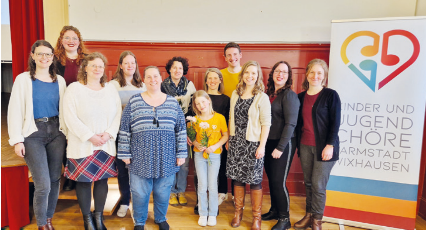
Der Vorstand der Kinder- und Jugendchöre Wixhausen.

Jahreshauptversammlung der Kinder- und Jugendchöre Darmstadt-Wixhausen