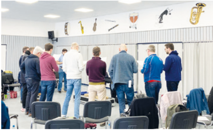
Unsere Männerstimmen in der Registerprobe.

Surprising bereitet sich auf Jubiläumskonzert vor