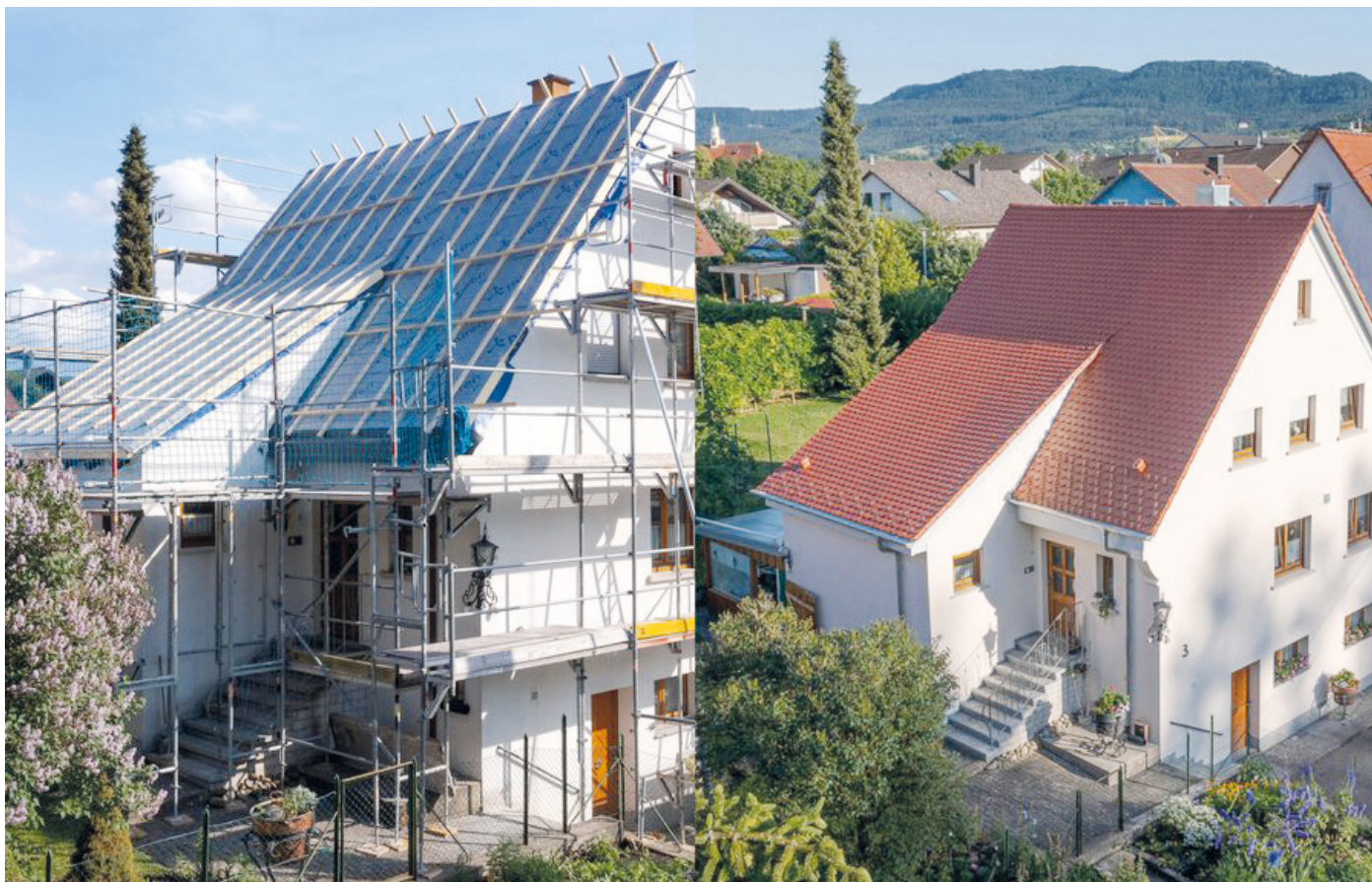
Mit einer zeitgemäßen Dämmung werden ältere Häuser fit für den wirtschaftlichen Betrieb einer Wärmepumpenheizung.

Energetische Haussanierung vorausschauend planen