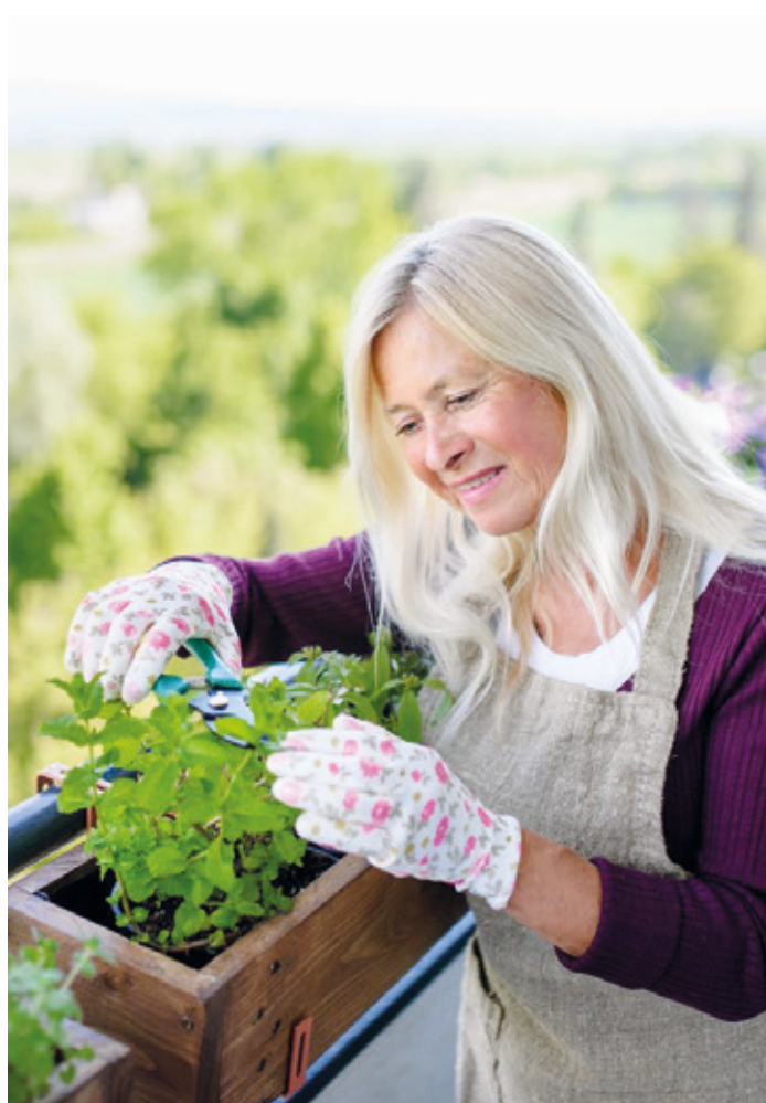
Fast alle Gemüse- und Kräutersorten wachsen und gedeihen im Balkonkasten genauso gut wie im Gartenbeet.

Einsteigern rät Patrick Dillmann dazu, zunächst beispielsweise mit pflegeleichten, wohlriechenden Kräutern wie Basilikum und Petersilien zu beginnen, die sich dann umgehend in der Küche bei der Zubereitung von Salaten und mediterranen Gerichten verwenden lassen: „Basilikum kann den