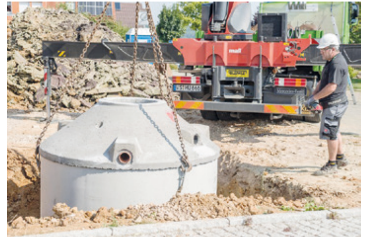
Eine Betonzisterne wird per Kran in die vorbereitete Garten-grube eingelassen.

(DJD) Das Trinkwasser ist in den vergangenen drei Jahren stetig teurer geworden. Den größten Anteil der kostbaren Flüssigkeit verbrauchen die Deutschen laut Statista beim Baden und Duschen, gefolgt von der Toilettenspülung und dem Wäschewaschen. Genau hier liegt ein nennenswertes Sparpotenzial, denn gerade Toilette und Waschmaschine müssen nicht mit teurem Trinkwasser betrieben werden. Dafür reicht die Versorgung mit Regenwasser. Auch für die Gartenbewässerung oder Reinigungsarbeiten am Haus können Hausbewohner das kostenlose Nass von oben nutzen. Dieses lässt sich beispielsweise in einer unterirdischen