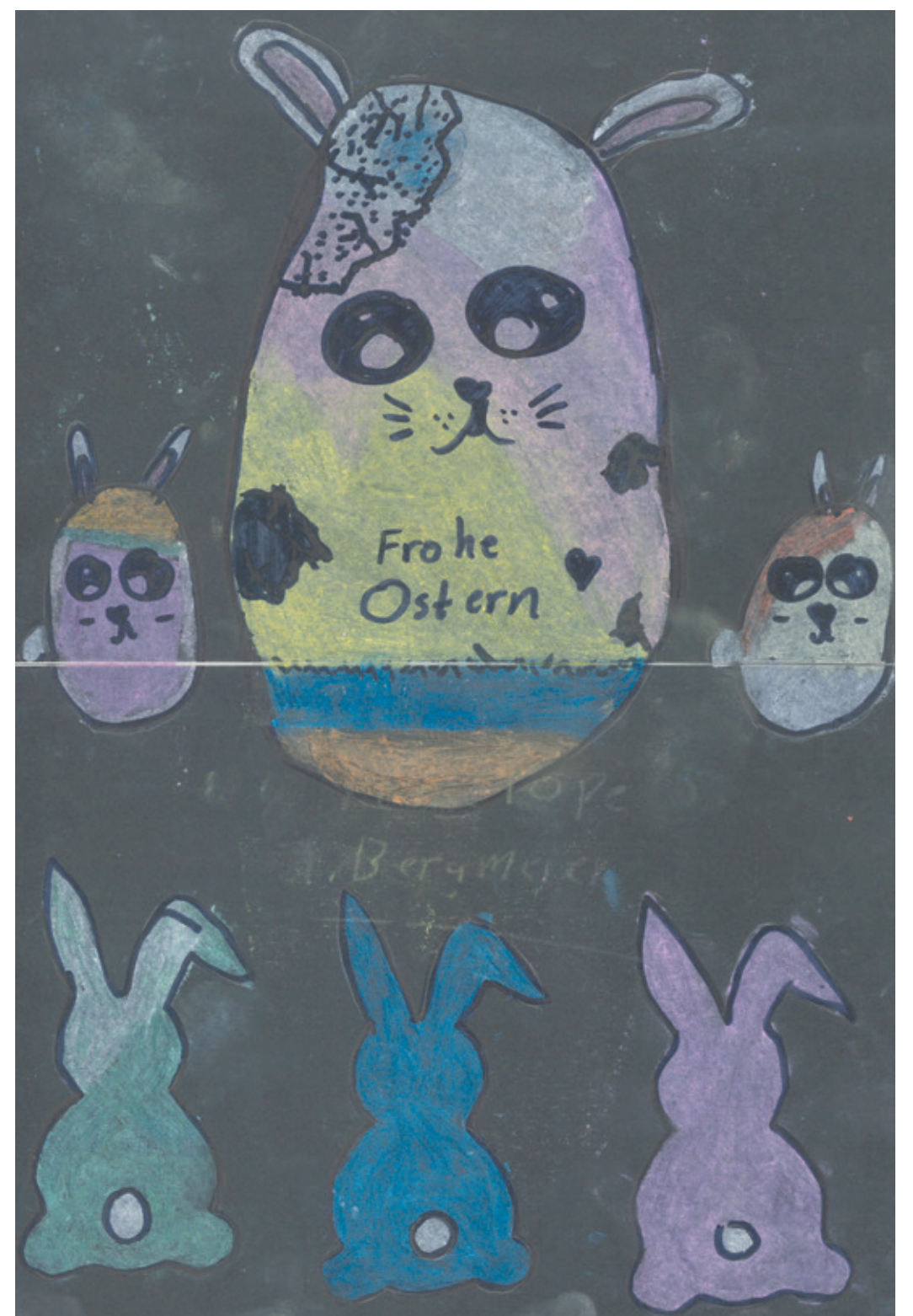
Penélope aus Darmstadt.