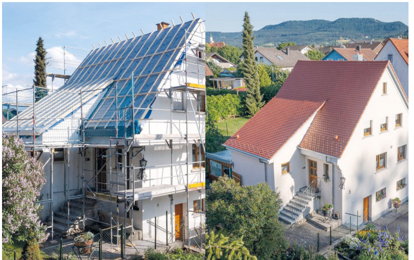
Mit einer zeitgemäßen Dämmung werden ältere Häuser fit für den wirtschaftlichen Betrieb einer Wärmepumpenheizung.

man setzt einzelne Akzente, die die vorhandene Optik auffrischen. „Die Gestalten-de“ von Naturinform bietet neben Holzoptiken auch Profile mit einer Linienstruktur. Diese sind in mehreren Breiten erhältlich und können sowohl waagrecht als auch senkrecht sowie in Kombination verlegt werden. Unter www.naturinform.de gibt es einen kostenlosen Fassadenplaner zum vorab Ausprobieren.