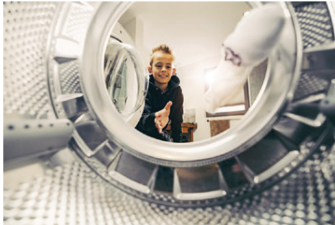
Um dreckige Wäsche sauber zu kriegen, kann man die Waschmaschine auch mit Regenwasser betreiben.

Gesammeltes Wasser aus der Zisterne für Toilette und Waschmaschine nutzen