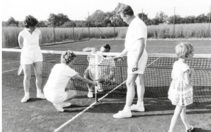
Erst im Jahr 1964 flogen in der Heegbachau die damals noch weißen Filzbälle – über Netze mit korrekter Höhe.

Aber zurück zu den Anfängen. Wenn Ende der 50er-Jahre/Anfang der 60er-Jahre wohl-situierte Eltern ihre Töchter oder Söhne zum Tennisspielen schicken wollten, mussten diese schon nach Darmstadt oder Langen gehen. In Erzhausen und der ganzen übrigen Umgebung gab es keinen Tennis-