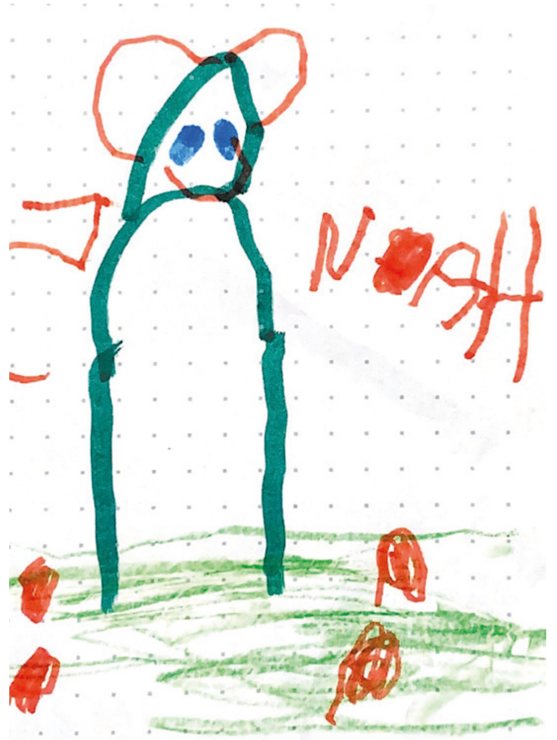
Noah, 5 Jahre alt aus Kranichstein.