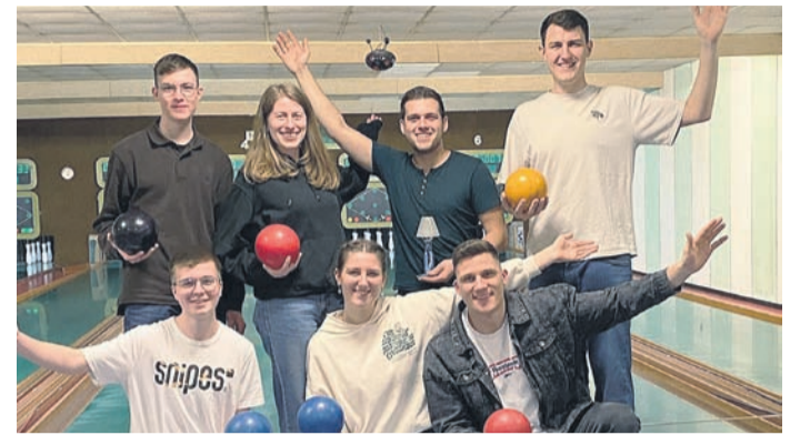
Jede Menge Spaß und sportlichen Ehrgeiz brachten die Eppertshäuser Kolpinger mit zu ihrer ersten Teilnahme am Bezirkskegelturnier der Kolpingsfamilien in Groß-Zimmern. Dieser Ehrgeiz wurde mit einem sehr guten 3. Platz belohnt.

Sieger das Feld verlassen würde und siegte verdient und deutlich mit 5:0. Vier Spieltage vor Schluss belegt die C1, die bisher alle zwölf Saisonspiele gewinnen konnte, mit 36 Punkten und einem Torverhältnis von 69:5 Tabellenplatz 1 und hat somit die große Chance, als erste Mannschaft seit vielen Jahren einen Kreismeistertitel für den FV Eppertshausen erringen zu können.