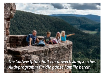
Die Südwestpfalz hält ein abwechslungsreiches Aktivprogramm für die ganze Familie bereit.

(epr) Wünscht man sich ein Ausflugsziel, wo Erlebnisreichtum für Groß und Klein an der Tagesordnung ist, dann ist man in der Südwestpfalz bestens aufgehoben. Wer auf historischen Pfaden wandeln möchte, findet bei der Burgenvielfalt der Region die perfekte Kulisse für einen Abstecher ins Mittelalter. In Richtung moderne Wissenschaft geht es im Science-Center „Dynamikum“ in Pirmasens, wo regelmäßige Mitmach-Events den Forscherdrang wecken. Zurück zur Natur findet man auf dem Barfußpfad bei Ludwigs-winkel, wo sich auf 1,6 km an zehn Erlebnisstationen mit den Füßen allerlei Wunderlichkeiten ertasten lassen. Tierfreunde können bei einem Waldspaziergang mit den niedlichen Alpakas vom Teufelstal auf Kuschelkurs gehen. Das passende „Basislager“ ist ebenfalls schnell gefunden, denn seit 2007 zeichnet die Südwestpfalz Gastgeber, die sich speziell auf die Bedürfnisse von Familien eingestellt haben, als „Kinder- und familienfreundliche Unterkünfte“ aus. Mehr unter www.reiseplaza.de/suedwestpfalz