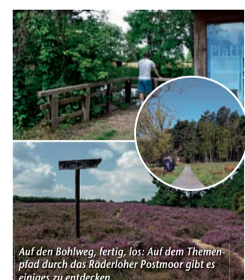
Auf den Bohlweg, fertig, los: Auf dem Themenpfad durch das Räderloher Postmoor gibt es einiges zu entdecken.

Einfach idyllisch! – Beim Wandern in der Südde Gifhorn die Seele baumeln lassen (epr) Raus aus der Stadt, rein in die Urlaubsregion Südde Gifhorn! Das Südtor zur Lüneburger Heide punktet mit Natur pur und einer facettenreichen Landschaft, die Groß und Klein begeistert – und das nicht nur zur Heidelblütezeit! Rund ums Jahr sorgen