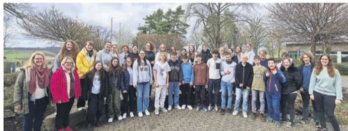
Rund 40 Konfirmandinnen und Konfirmanden, Teamerinnen und Teamer sowie hauptamtliche Mitarbeiter besuchten zusammen das Jugendzentrum Ronneburg.

War die erste Nacht kurz, so ging es am Freitagmorgen nach dem Frühstück mit Stationenarbeit weiter. Dabei schaffte es das Team von haupt- und ehrenamtlichen, jugendlichen Mitarbeitern, die Konfis mit allen Sinnen anzusprechen und ihre Erfahrungen mit dem Sehen, mit der Bibel und Gott zu machen. Beispielsweise konnte