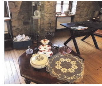
Noch wird die Ausstellung aufgebaut. Am Sonntag ist dann alles für die Besucher bereit.

Wenn die Tassen nicht im Schrank sind, ist meistens der Tisch gedeckt, sagten sich die HGVler vom Arbeitskreis für Zeitgeschichte und organisierten alles, was zu einem gedeckten Tisch gehört. Dass es sich dabei um Tische aus verschiedenen Epochen handelt, ist bei einem Geschichtsverein selbstverständlich. Bis zum 1. Oktober kann die Ausstellung am ersten Sonntag im Monat besichtigt werden. Vom einfachen Holztisch, bei dem die gekochten Kartoffeln der bäuerlichen Bevölkerung in Vertiefungen gefüllt wurden, bis zu der besseren Kaffeetafel, reicht der Rahmen, den das Heimatmuseum zu bieten hat. In dem Museum vorgelagerten Außenbereich zeigt der HGV