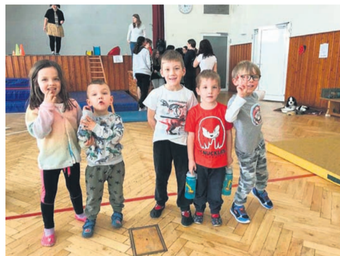
Kürzlich folgten einige Kinder des TAV 1890 der Einladung des Turgau Offenbach-Hanau zum Kindererlebnistag nach Heusenstamm. Unter dem Motto „Tag auf dem Bauernhof“ luden dort verschiedene Gerätelandschaften zum Balancieren, Klettern und Schaukeln ein. Alle TAV-Kinder hatten bei ihrem Besuch auf dem Bauernhof großen Spaß.