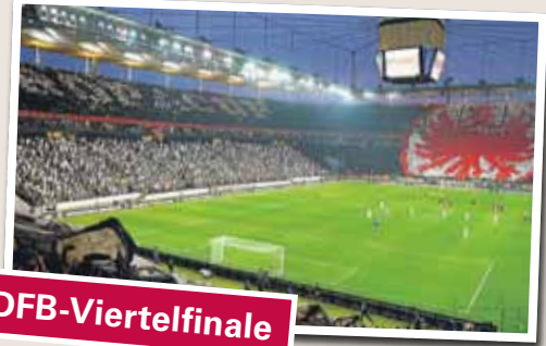
SGE gegen Union Berlin Pokal im DFB-Viertelfinale