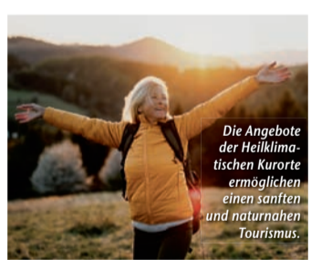
Die Angebote der Heilklimatischen Kurorte ermöglichen einen sanften und naturnahen Tourismus.

Urlaub für die Gesundheit – Heilklimatische Kurorte stärken Körper und Geist der ganzen Familie (epr) Bereits seit Jahrzehnten bieten die Heilklimatischen Kurorte in Deutschland ihren Gästen ganzjährig ein vielfältiges Angebot. Hier findet man Entspannung und Erholung, Sport und Spaß sowie Individualität und Ruhe – und zwar alles im Zeichen des körperlichen Wohlbefindens. Dabei helfen Ärzte und Therapeuten, die Klimareize wie ein Medikament verabreichen, am häufigsten in Kombination mit Bewegung, bspw. beim Heilklima-Wandern. In vielen Heilklimatischen Kurorten gibt es auch eine ganze Reihe von kindgerechten Angeboten und Veranstaltungen, die beim Nachwuchs manchmal eher auf Zuspruch stoßen als das Heilklima-Wandern. Wie wäre es mit betreutem Spielen, speziellen Sportkursen oder z. B. der Gestaltung einer eigenen Harry Potter-Aufführung? Beliebte sind auch die Wellnesswochen für die Kleinen, die unter Bewegungsarmut oder falscher Ernährung leiden. So sind die Kinder bestens versorgt, während die Eltern auf ihre Art den Urlaub genießen und entspannen können. Mehr Informationen unter www.reiseplaza.de/heilklima