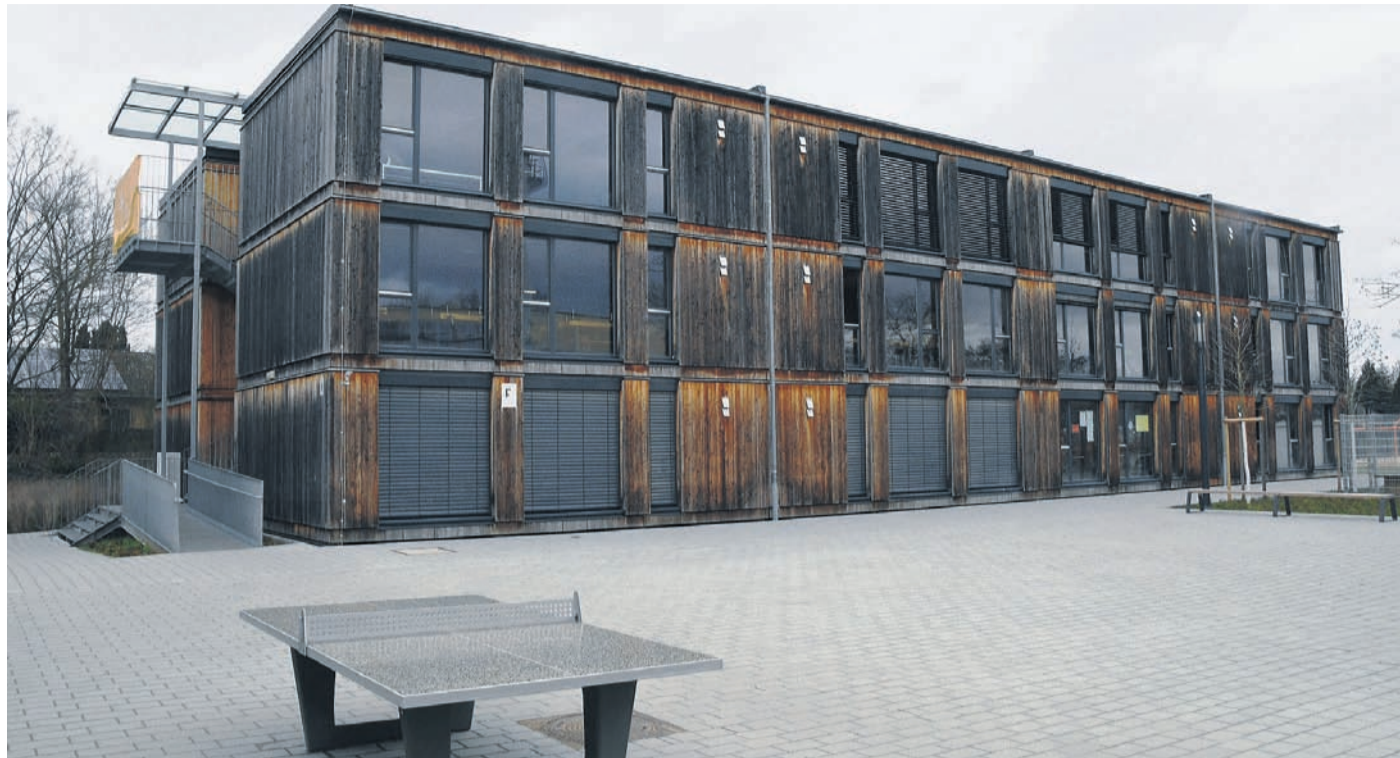
Als Provisorium gedacht, nun aber eine Dauerlösung: die „mobi:skul“ an der Münsterer Schule auf der Aue.

Die Münsterer Schule auf der Aue freundet sich mit der lange kritisierten mobi:skul an / Da-Di-Werk hat viel verbessert