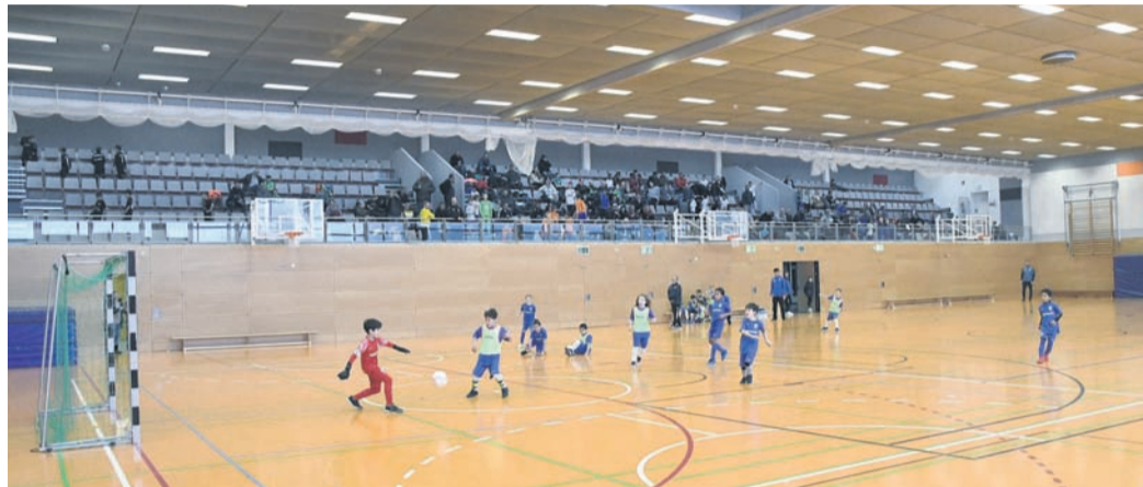
Die Nutzung kommunaler Liegenschaften wie der Gersprenzhalle (hier bei einem Junioren-Fußballturnier der SV Münster) soll nach dem Willen der CDU für die örtlichen Vereine günstiger werden, etwa durch den Wegfall bislang durchs Rathaus berechneter Pauschalen für Strom und Heizung. Eine Entscheidung dazu fiel in der Gemeindevertreter-Sitzung am Montagabend aber noch nicht. Das Thema wird weiter beraten.

Gendern im Rathaus: Die CDU hatte einen Antrag gestellt, nach dem im Schriftverkehr der Gemeinde Gendersternchen und Binnen-I sowie Doppelpunkte und Unterstriche inmitten von Wörtern (Bürger*innen, Bürge-