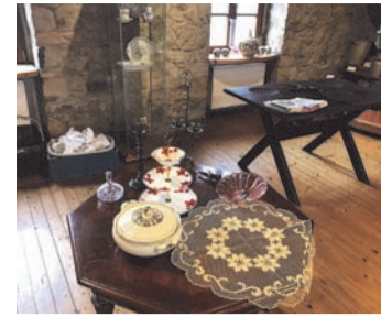
Noch wird die Ausstellung aufgebaut. Am Sonntag ist dann alles für die Besucher bereit.

Wenn die Tassen nicht im Schrank sind, ist meistens der Tisch gedeckt, sagten sich die HGVler vom Arbeitskreis für Zeitgeschichte und organisierten alles, was zu einem gedeckten Tisch gehört. Dass es sich dabei um Tische aus verschiedenen Epochen handelt, ist bei einem Geschichtsverein selbstverständlich. Bis zum 1. Oktober kann die Ausstellung am ersten Sonntag im Monat besichtigt werden. Vom einfachen Holztisch, bei dem die gekochten Kartoffeln der bäuerlichen Bevölkerung in Vertiefungen gefüllt wurden, bis zu der besseren Kaffeetafel, reicht der Rahmen, den das Heimatmuseum zu bieten hat. In dem Museum vorgelagerten Außenbereich zeigt der HGV