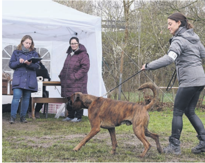
Posieren vor der Wettkampfrichterin: Bei der Spezial-Rassehund-Ausstellung des Boxerklubs Dieburg-Eppertshausen wurden die Boxer am Sonntag in 14 Rüden- und 13 Hündinnen-Klassen bewertet.

Sie konnten bei der Bewertung der Tiere durch die Wettkampfrichterinnen hautnah dabei sein. Unterteilt waren die Boxer in 14 Rüden- und 13 Hündinnen-Klassen. Bemerkenswert aus Sicht der Gastgeber war der erste Platz von Grace von Alcazar aus dem gleichnamigen Dieburger Zwinger. Die