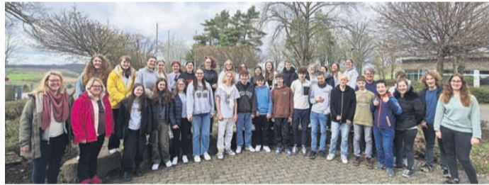
Rund 40 Konfirmandinnen und Konfirmanden, Teamerinnen und Teamer sowie hauptamtliche Mitarbeiter besuchten zusammen das Jugendzentrum Ronneburg.

War die erste Nacht kurz, so ging es am Freitagmorgen nach dem Frühstück mit Stationenarbeit weiter. Dabei schaffte es das Team von haupt- und ehrenamtlichen, jugendlichen Mitarbeitern, die Konfis mit allen Sinnen anzusprechen und ihre Erfahrungen mit dem Sehen, mit der Bibel und Gott zu machen. Beispielsweise konnte