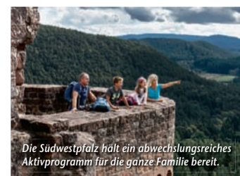
Die Südwestpfalz hält ein abwechslungsreiches Aktivprogramm für die ganze Familie bereit.

Große Abenteuer für kleine Entdecker – Beim Familienurlaub in der Südwestpfalz facettenreiche Aktivitäten voller Spiel, Spaß und Spurensuche erleben (epr) Wünscht man sich ein Ausflugsziel, wo Erlebnisreichtum für Groß und Klein an der Tagesordnung ist, dann ist man in der Südwestpfalz bestens aufgehoben. Wer auf historischen Pfaden wandeln möchte, findet bei der Burgenvielfalt der Region die perfekte Kulisse für einen Abstecher ins Mittelalter. In Richtung moderne Wissenschaft geht es im Science-Center „Dynamikum“ in Pirmasens, wo regelmäßige Mitmach-Events den Forscherdrang wecken. Zurück zur Natur findet man auf dem Barfußpfad bei Ludwigs-winkel, wo sich auf 1,6 km an zehn Erlebnisstationen mit den Füßen allerlei Wunderlichkeiten ertasten lassen. Tierfreunde können bei einem Waldspaziergang mit den niedlichen Alpakas vom Teufelstal auf Kuschelkurs gehen. Das passende „Basislager“ ist ebenfalls schnell gefunden, denn seit 2007 zeichnet die Südwestpfalz Gastgeber, die sich speziell auf die Bedürfnisse von Familien eingestellt haben, als „Kinder- und familienfreundliche Unterkünfte“ aus. Mehr unter www.reiseplaza.de/suedwestpfalz