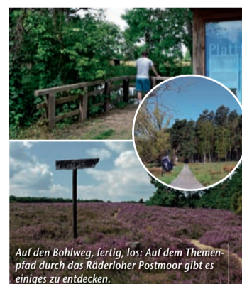
Auf den Bohlweg, fertig, los: Auf dem Themenpfad durch das Räderloher Postmoor gibt es einiges zu entdecken.

Einfach idyllisch! – Beim Wandern in der Südde Gifhorn die Seele baumeln lassen (epr) Raus aus der Stadt, rein in die Urlaubsregion Südheide Gifhorn! Das Südtor zur Lüneburger Heide punktet mit Natur pur und einer facettenreichen Landschaft, die Groß und Klein begeistert – und das nicht nur zur Heidelblütezeit! Rund ums Jahr sorgen