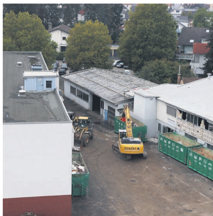
Im vergangenen Herbst haben die Abrissarbeiten auf dem Areal begonnen, die Firmengebäude sind jetzt nicht mehr vorhanden.

Für die Öffentlichkeit liegen die Unterlagen nun noch bis Freitag, 21. April, im Rathaus in der Schubertstraße 11 aus. Diese können von Interessierten während der Öffnungszeiten (montags bis freitags von 8 bis 12.30 Uhr sowie mittwochs von 15 bis 18.30 Uhr) eingesehen werden. Außerdem sind die Daten auf der Internetseite der Stadt Obertshausen www.obertshausen.de unter dem Punkt „Aktuelles“ und „Offenlagen“ zu finden. In diesem Zeitraum können die Bürgerinnen und Bürger zur Planung schriftlich Stellung