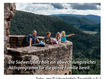
Die Südwestpfalz hält ein abwechslungsreiches Aktivprogramm für die ganze Familie bereit.

(epr) Wünscht man sich ein Ausflugsziel, wo Erlebnisreichtum für Groß und Klein an der Tagesordnung ist, dann ist man in der Südwestpfalz bestens aufgehoben. Wer auf historischen Pfaden wandeln möchte, findet bei der Burgenvielfalt der Region die perfekte Kulisse für einen Abstecher ins Mittelalter. In Richtung moderne Wissenschaft geht es im Science-Center „Dynamikum“ in Pirmasens, wo regelmäßige Mitmach-Events den Forscherdrang wecken. Zurück zur Natur findet man auf dem Barfußpfad bei Ludwigs-winkel, wo sich auf 1,6 km an zehn Erlebnisstationen mit den Füßen allerlei Wunderlichkeiten ertasten lassen. Tierfreunde können bei einem Waldspaziergang mit den niedlichen Alpakas vom Teufelstal auf Kuschelkurs gehen. Das passende „Basislager“ ist ebenfalls schnell gefunden, denn seit 2007 zeichnet die Südwestpfalz Gastgeber, die sich speziell auf die Bedürfnisse von Familien eingestellt haben, als „Kinder- und familienfreundliche Unterkünfte“ aus. Mehr unter www.reiseplaza.de/suedwestpfalz