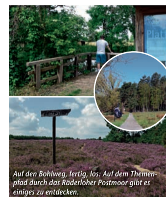
Auf den Bohlweg, fertig, los: Auf dem Themenpfad durch das Räderloher Postmoor gibt es einiges zu entdecken.

Einfach idyllisch – Beim Wandern in der Südheide Gifhorn die Seele baumeln lassen (epr) Raus aus der Stadt, rein in die Urlaubsregion Südheide Gifhorn! Das Südtor zur Lüneburger Heide punktet mit Natur pur und einer facettenreichen Landschaft, die Groß und Klein begeistert – und das nicht nur zur Heideblütezeit! Rund ums Jahr sorgen