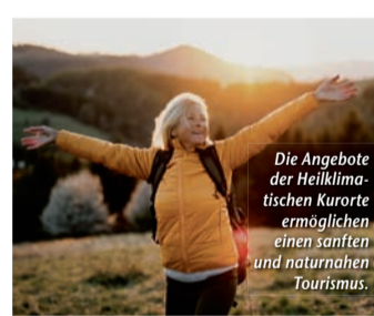
Die Angebote der Heilklimatischen Kurorte ermöglichen einen sanften und naturnahen Tourismus.