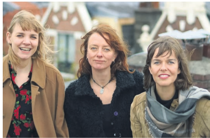
„The Lasses“ sind am Samstag im Maximal zu erleben.

vom Straßenverkehr geradelt. Zwischendrin oder manchmal auch erst am Ende wird ein Lokal angesteuert, um dort in geselliger Runde den Tag ausklingen zu lassen. Gegen 22 Uhr wird man wieder zurück sein. Eine funktionierende Lichtanlage ist erforderlich, denn die Rückfahrt kann gerade bei kürzeren Tagen in der Dunkelheit erfolgen. Infos gibt es per Email unter fat-team@adfc-rodgau.de. Die kürzeren Feierabendtouren, die ca. 25 km lang sind mit eher einem gemütlichen Tempo und von 19 bis 21 Uhr dauern (keine Einkehr), werden voraussichtlich im Mai starten. Hier kann man sich das Tourenheft für 2023 ansehen und runterladen: https://www.adfc-rodgau.de/dokus/ADFC-Tourenheft-2023_Ostkreis.pdf Weitere Informationen über den ADFC Rodgau stehen auch im Internet unter www.adfc-rodgau.de bereit.