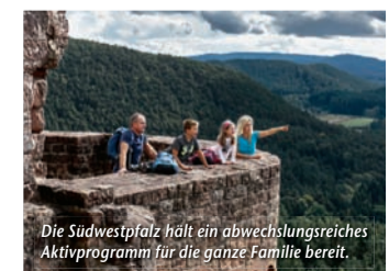
Die Südwestpfalz hält ein abwechslungsreiches Aktivprogramm für die ganze Familie bereit.

Große Abenteuer für kleine Entdecker – Beim Familienurlaub in der Südwestpfalz facettenreiche Aktivitäten voller Spiel, Spaß und Spurensuche erleben (epr) Wünscht man sich ein Ausflugsziel, wo Erlebnisreichtum für Groß und Klein an der Tagesordnung ist, dann ist man in der Südwestpfalz bestens aufgehoben. Wer auf historischen Pfaden wandeln möchte, findet bei der Burgenvielfalt der Region die perfekte Kulisse für einen Abstecher ins Mittelalter. In Richtung moderne Wissenschaft geht es im Science-Center „Dynamikum“ in Pirmasens, wo regelmäßige Mitmach-Events den Forscherdrang wecken. Zurück zur Natur findet man auf dem Barfußpfad bei Ludwigs-winkel, wo sich auf 1,6 km an zehn Erlebnisstationen mit den Füßen allerlei Wunderlichkeiten ertasten lassen. Tierfreunde können bei einem Waldspaziergang mit den niedlichen Alpakas vom Teufelstal auf Kuschelkurs gehen. Das passende „Basislager“ ist ebenfalls schnell gefunden, denn seit 2007 zeichnet die Südwestpfalz Gastgeber, die sich speziell auf die Bedürfnisse von Familien eingestellt haben, als „Kinder- und familienfreundliche Unterkünfte“ aus. Mehr unter www.reiseplaza.de/suedwestpfalz