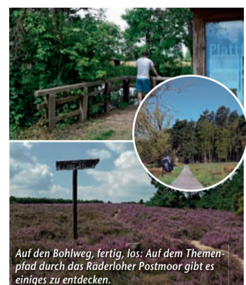
Auf den Bohlweg, fertig, los: Auf dem Themenpfad durch das Räderloher Postmoor gibt es einiges zu entdecken.

Einfach idyllisch! – Beim Wandern in der Südde Gifhorn die Seele baumeln lassen (epr) Raus aus der Stadt, rein in die Urlaubsregion Südheide Gifhorn! Das Südtor zur Lüneburger Heide punktet mit Natur pur und einer facettenreichen Landschaft, die Groß und Klein begeistert – und das nicht nur zur Heideblütezeit! Rund ums Jahr sorgen