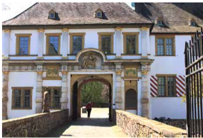
Das „Alte Schloss“ lädt mit seinem imposanten Eingang zum Verweilen ein.

Die Hoechst GmbH hat es geschafft, den gleichnamigen Stadtteil auf der ganzen Welt bekannt zu machen. Der Konzern gehört heute noch zu einem der drei größten Chemie- und Pharmakonzerne Deutschlands. 1863 gründeten drei Frankfurter die