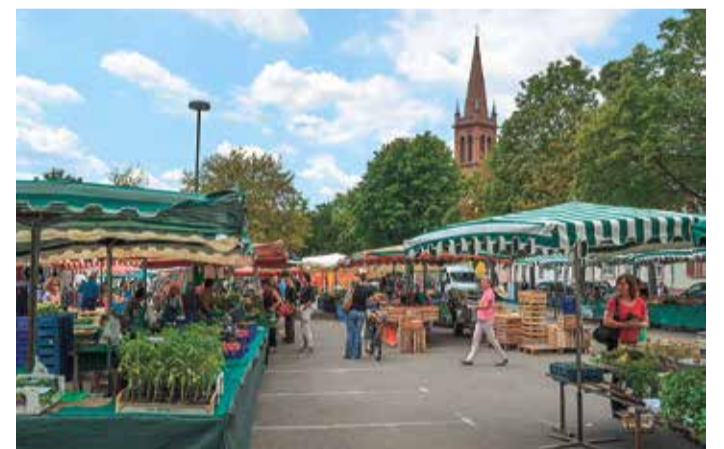
Jeden Dienstag, Freitag und Samstag werden Frische Waren angeboten.

Wer auf der Suche nach frischem Obst und Gemüse ist, wird auf dem Wochenmarkt und der Markthalle Höchst fündig. Der Markt ist 3-mal pro Woche für Besucherinnen und Besucher geöffnet und bietet exotische Früchte und heimische Bio-Produkte. Für jeden, der sehr gute Qualität schätzt, ist etwas dabei. Die Marktbesucherinnen und -besucher erhalten die Möglichkeit, viele der Leckereien zu probieren, hier und da einen netten Plausch mit dem Händler zu halten und die ein oder andere neue Rezeptidee zu ergattern.