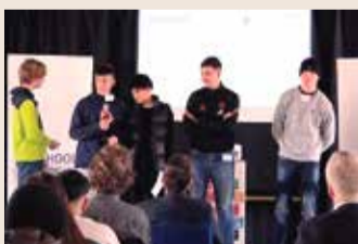
Teilnehmer der fünften Schools Challenge in Frankfurt.

The Schools Challenge Frankfurt hat vor fünf Jahren zum ersten Mal stattgefunden. Seit dem Beginn der Aktion hat sich das Programm stetig weiterentwickelt und die Veranstaltung ist größer geworden. Doch die Absicht dahinter ist gleichgeblieben. Die teilnehmenden Schüler aus den neunten Klassen entwickeln Ideen, wie sie Frankfurt nachhaltiger machen können. Dabei lernen sie wirtschaftliche Kompetenzen, die nicht im normalen Unterricht vermittelt werden. Herausgekommen ist dabei in diesem Jahr beispielsweise eine solarbetriebene Rikscha, um in Frankfurt nachhaltig von A nach B zu kommen oder ein Mini-Kraftwerk, mit dem jedes Haus Abwasser in Strom verwandeln kann.