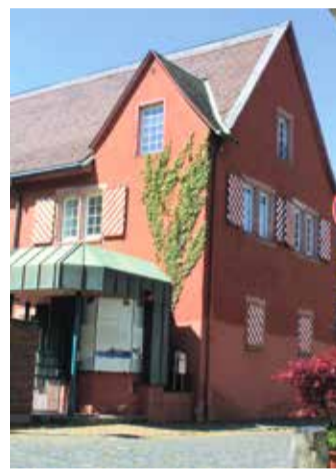
Das „Neue Schloss“ dient heute als Heimatmuseum.

Ausklang bildet das Fest durch ein großes Feuerwerk direkt über dem Main. Jedes Jahr werden die Höchster mit dem Schlossfest-Heft über das Programm auf dem Laufenden gehalten. Alle Ausgaben seit 1957 wurden gesammelt und stehen online unter www.schloss-fest.de zur Einsicht.