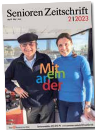
Titelseite der neuen Broschüre.

RÖMER (PM) | „Miteinander“ lautet das Titelthema der zweiten Ausgabe der Senioren Zeitschrift (SZ), die am Dienstag, 4. April, erscheint. Denn Miteinander und Füreinander statt Gegeneinander sind in Frankfurt, dieser weltoffenen Metropole im Kleinformate, seit jeher gelebte Praxis. Schließlich leben und arbeiten hier mehr als 764.000 Menschen aus über 170 Nationen friedlich zusammen.