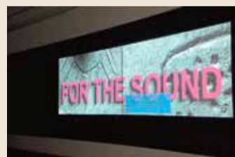
Ausstellung „SOUND OF THE BREAK“ in der Schirn Kunsthalle Frankfurt.

Recherche sowie die Sichtung von Materialsammlungen. Die Bewegtbild-Künstlerin Elisabeth Price macht die Transformation des Digitalen sichtbar, indem sie Bild, Text und Sound zu Rauminstallationen komponiert, kulturelle und sozio-politische Begebenheiten neu inszeniert und wenig beachtete Geschichten in den Fokus nimmt. Zwei neue und erstmals in Deutschland gezeigte Rauminstallationen der Turner-Preisträgerin sind aktuell in der Schirn Kunsthalle Frankfurt zu sehen. Die Ausstellung „SOUND OF THE BREAK“ umfasst vier Videos in einer Länge von jeweils 10 bis 15 Minuten. In einem dritten Raum wird anhand von vier während des Corona-Lockdowns entstandenen Video-Lectures gezeigt, wie die Bewegtbildkünstlerin arbeitet. Ein wiederkehrendes Thema bei Price ist die durch die Digitalisierung veränderte Arbeitswelt. Ihre Videos verfremden die Vergangenheit bis zur Unkenntlichkeit und versetzen sie mit neuer, verführerischer und anarchischer Energie. Noch bis zum 29. Mai 2023 können Besucherinnen und Besucher die Bewegtbild-Arbeiten der 57 Jahre alten Künstlerin erleben.