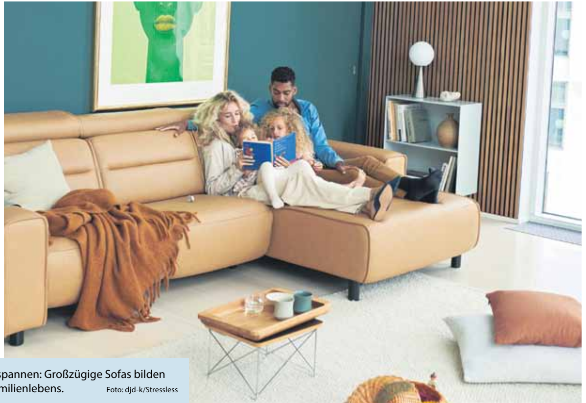
Gemeinsam kuscheln, lesen und entspannen: Großzügige Sofas bilden den gemütlichen Mittelpunkt des Familienlebens.

(DJD-K). Eine gemütliche Lounge-landschaft für die ganze Familie: Großzügige Sitzlandschaften bilden oft den Mittelpunkt des Wohnbereichs. Sie sollen genug Platz für alle bieten und sich immer wieder anderen Vorlieben und Wünschen anpassen lassen. Für Stressless-Sofas zum Beispiel werden in Norwegen hochwertige Leder- und Stoffqualitäten nach handwerklichen Methoden verarbeitet. Unter der ansprechenden Außenhaut verbirgt sich robuste und vielseitige Technik. Besonders viel Komfort bieten etwa die motorisierten Emily-Sofas. Aufgrund des modularen Aufbaus kann sich jede Familie das Lieblingsmodell selbst zusammenstellen und beliebig viele Sitze miteinander verbinden. Probesitzen und Beratungen sind im Möbelfachhandel vor Ort möglich, unter www.stressless.com gibt es vorab weitere Inspirationen.