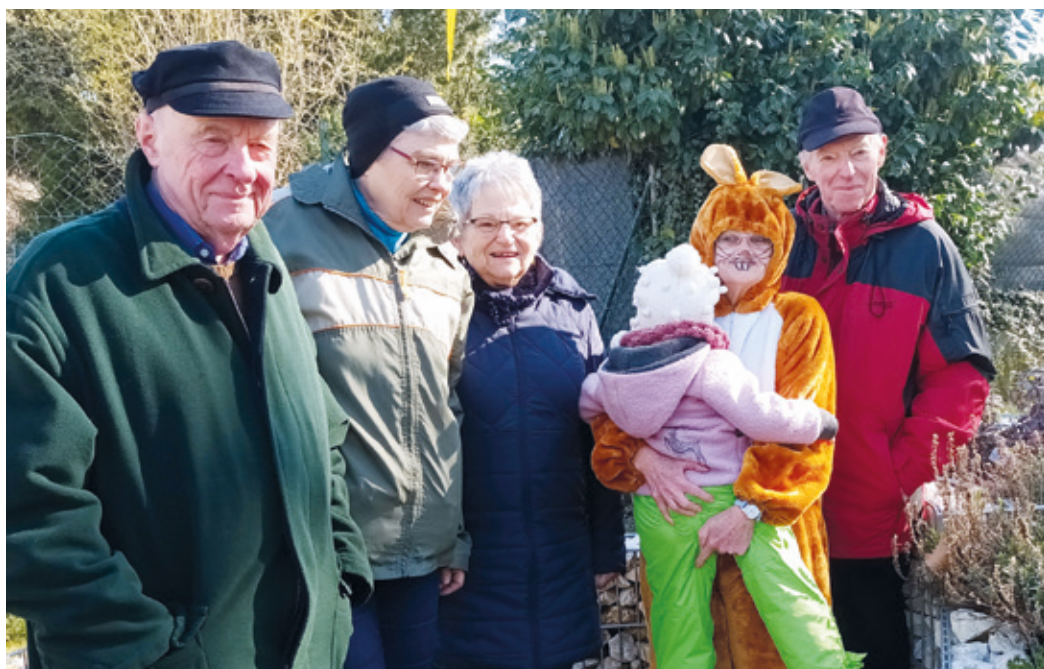
Osterhase, Senioren und eins der 12 Krippenkinder.

(ev) Auch dieses Jahr wurden am Mittwoch vor Ostern im Hof Ostendstraße 27–29 wieder bunte Eier versteckt. Es war ein kleines Jubiläum, denn vor genau 10 Jahren trat der Osterhase der Aktiven Senioren zum ersten Mal in Aktion! Gegen 10 Uhr kamen die Krippenkinder vom „Kinderhaus