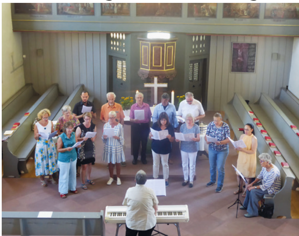
Projektchor am 17. Juli 2022 im Gottesdienst in Wixhausen.