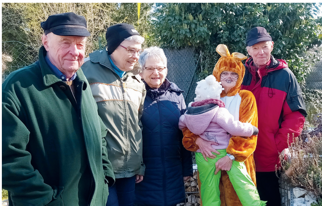
Osterhase, Senioren und eins der 12 Krippenkinder.

(ev) Auch dieses Jahr wurden am Mittwoch vor Ostern im Hof Ostendstraße 27–29 wieder bunte Eier versteckt. Es war ein kleines Jubiläum, denn vor genau 10 Jahren trat der Osterhase der Aktiven Senioren zum ersten Mal in Aktion! Gegen 10 Uhr kamen die Krippenkinder vom „Kinderhaus