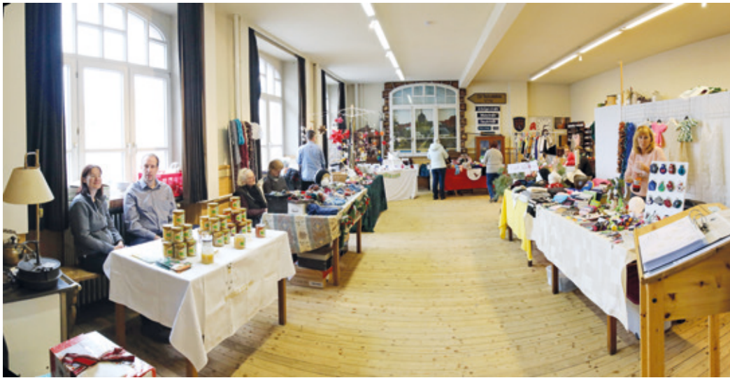
Blick in einen der beiden Ausstellungsräume während der letzten Ausstellung vor Corona.