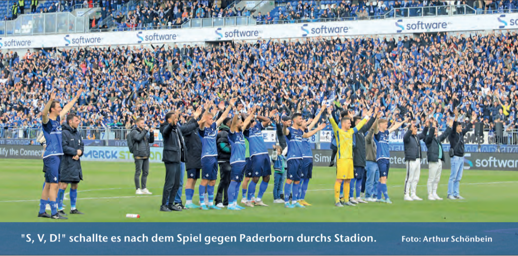
"S, V, D!" schallte es nach dem Spiel gegen Paderborn durchs Stadion.