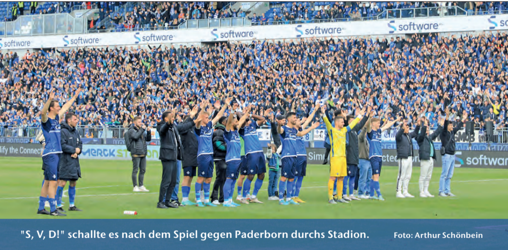
"S, V, D!" schallte es nach dem Spiel gegen Paderborn durchs Stadion.