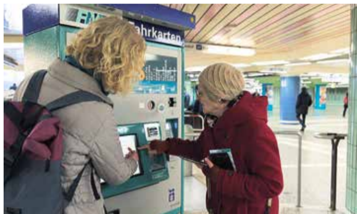
Unter fachkundiger Anleitung wird der Fahrkartenkauf am Automaten zum Kinderspiel.

Die Veranstaltung „Nahverkehr ganz leicht“ findet jeden dritten Dienstag im Monat statt. Einsteigerinnen und Einsteiger ab 60 Jahren lernen darin alles, was sie benötigen, um sich in den Bahnen und Bussen im Rhein-Main-Gebiet gut zurechtzufinden. Die Kursteilnahme ist kostenfrei. traffiQ bittet um eine Anmeldung unter anmeldung@traffiQ.de . Mit der Bestätigung erhalten Teilnehmende auch Details zum Treffpunkt.