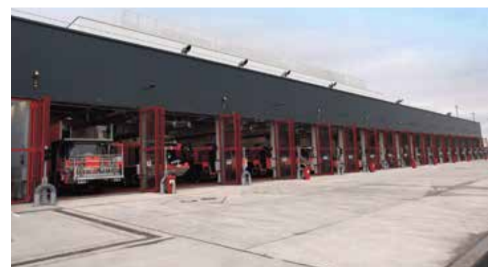
Eines der beeindruckenden Gebäude der Flughafenfeuerwehr.