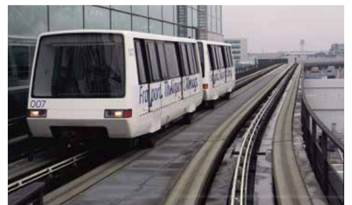
Die SkyLine Hochbahn.

Feuerwehrleute der Flughafenfeuerwehr und anderer Feuerwehren diverse Lehrgänge besuchen können. Die Feuerwache 2 ist für den Flugzeugbrandschutz auf dem Vorfeld und dem Parallelbahnsystem zuständig. Die Feuerwache 3, die früher