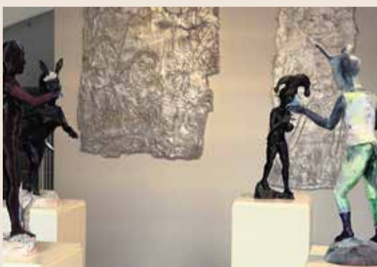
Ausstellung „And this is us 2023 – Junge Kunst aus Frankfurt“ im Steinernen Haus am Römerberg.

Regelmäßig stellt der Frankfurter Kunstverein Bilder junger Künstler aus. Mit „And this is us 2023 – Junge Kunst aus Frankfurt“ passiert das in diesem Jahr bereits zum vierten Mal. Insgesamt elf Kunststudenten von der Städelschule in Frankfurt und der Hochschule für Gestaltung Offenbach zeigen ihre ganz unterschiedlichen Werke. Von gemalten Bildern über Skulpturen bis hin zu Videoinstallationen. Für die Studenten ist die Ausstellung eine große Chance, gibt sie ihnen doch Gelegenheit institutionelle großformatige Arbeiten zu konzipieren und auch zu zeigen. Finanziert wird das Ausstellungsformat, wie auch in den Jahren zuvor, von der gemeinnützigen Dr. Marschner Stiftung. Die Kunstschau im Steinernen Haus am Römerberg ist noch bis zum 11. Juni 2023 immer von Dienstag bis Sonntag geöffnet. Außerdem gibt es ein umfangreiches Begleitprogramm in Form von Vorträgen und Führungen.