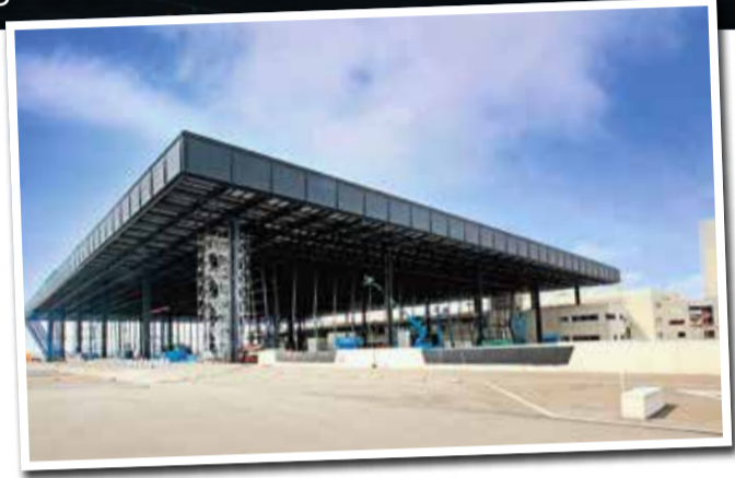
Blick die Baustelle und auf das Hauptgebäude des neuen Terminal 3.

nur aufgrund seiner Lage von Interesse, sondern zeichnet sich auch durch eine hohe Aufenthaltsqualität, eine intelligente Vernetzung und eine attraktive Business-Community aus. Viele wissenschaftliche Unternehmen haben bereits von der Nähe zu zahlreichen Universitäten, Fachhochschulen und Instituten der Region profitiert und sich in Gateway Gardens niedergelassen. Aktuell beherbergt das Quartier 30 internationale Unternehmen und neun Hotels. Bis 2024 sollen hier mehr als 25.000 Menschen ihren Arbeits- und Lebensmittelpunkt haben. Eine weitere Besonderheit von Gateway Gardens ist, dass es aufgrund der starken Lärmbelastung durch den Flughafen keine Wohnungen gibt. Stattdessen wird das Viertel vorwiegend für Büro- und Konferenzgebäude, Hotels und Gastronomiebetriebe genutzt. Mit diesem innovativen Konzept wird Gateway Gardens zu einem wichtigen Bestandteil des globalen Wirtschaftsnetzwerks und trägt zu Frankfurts Ruf als wichtiger Business-Standort bei.