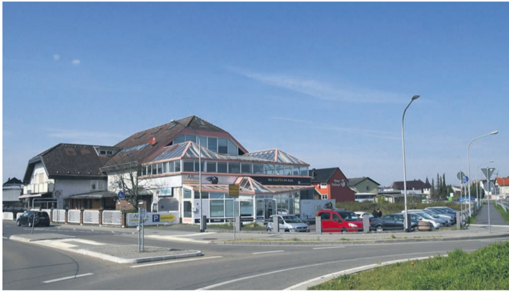
In einem Teil des „Tropical“ und auf dem Parkplatz haben sich seit wenigen Tagen eine Automobilagentur und eine Leasingfirma eingemietet. Abriss der ehemaligen Kultdisko und Neubebauung des 2.000 Quadratmeter großen Geländes sind erstmal vom Tisch.

Münster (jedö) Eine der prominentesten Flächen in Münster, die ihrer Entwicklung harrn, bleibt auf absehbare Zeit weitgehend, wie sie ist: Die Dieburger G&C Projektentwicklung GmbH, die 2016 das „Tropical“-Gelände vom privaten Vorbesitzer erwarb, plant inzwischen keinen Abriss der ehemaligen Kultdiskothek und keine Neubebauung des Grundstücks mehr. Stattdessen ist die weithin bekannte Ex-Disko nun teilweise neu vermietet worden. In wenigen Jahren soll eine richtungsweisende Entscheidung zur langfristigen Zukunft der Immobilie fallen, die ortsbildprägend am Münsterer Ortsausgang Richtung Altheim liegt.