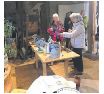
Es gibt viel zu sehen und es gibt viel darüber zu reden, wie hier am Tisch der Alltagsgegenstände.