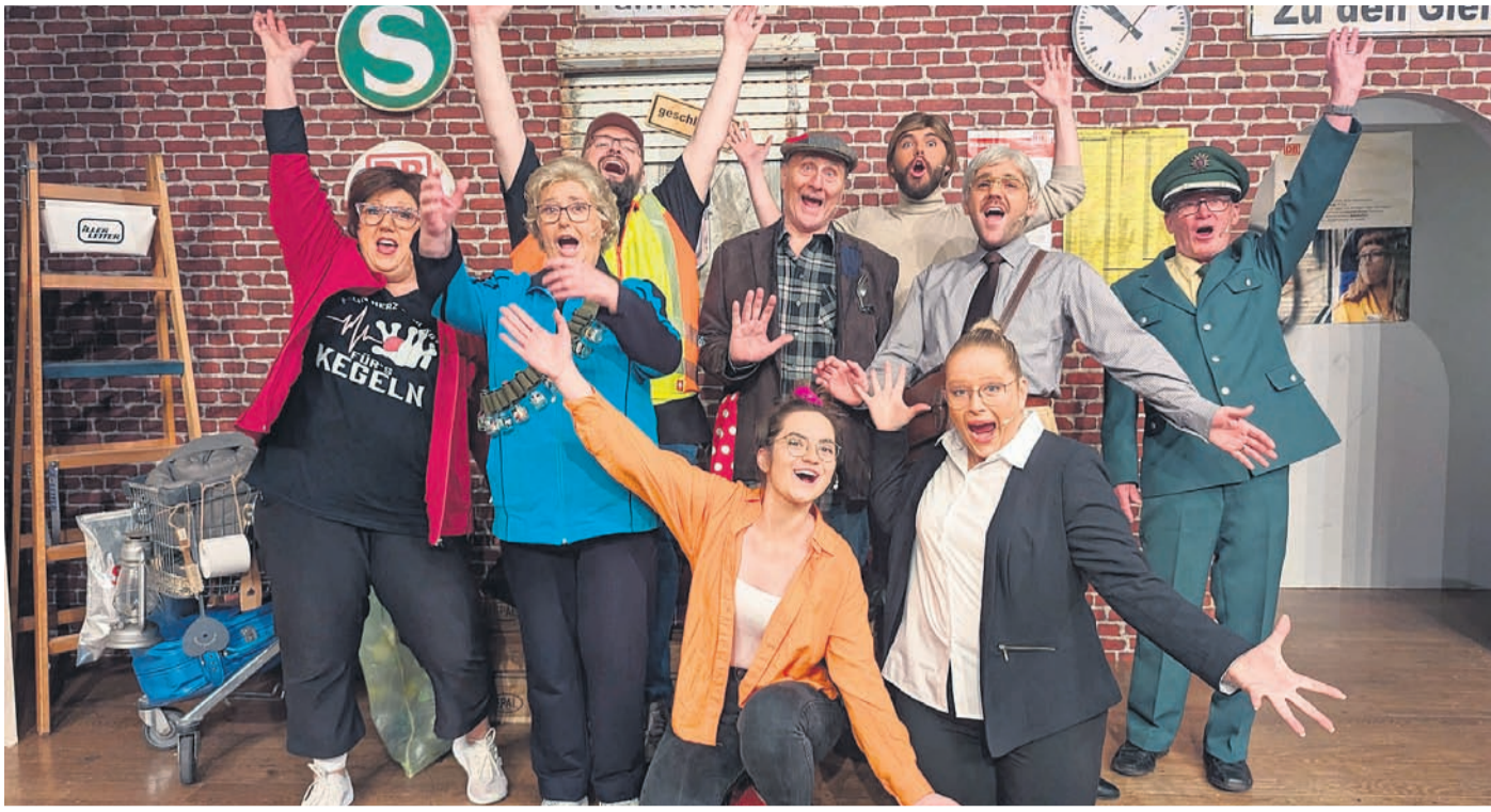
Die Laienspielgruppe erfreute das Publikum mit einem heiteren Stück rund um die Bahn.