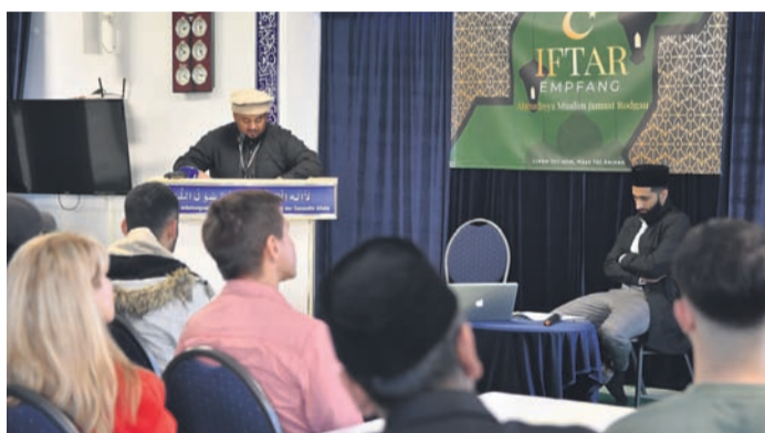
Ziel der Veranstaltung war es das Konzept des islamischen Fastens vorzustellen sowie gemeinsam mit Ihnen beim Abendessen ins Gespräch zu kommen.