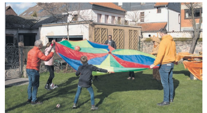
Spaß für Groß und Klein.

Spielerisch Adolph Kolping und die Kolpingsfamilien kennenlernen