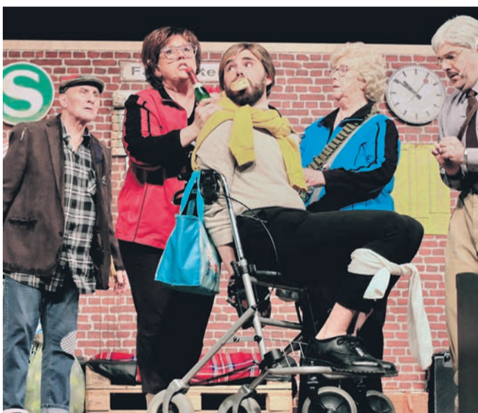
Turbulent ging es zu im Provinzbahnhof Nieder-Roden.

Mit Talent und Fleiß ausgespielte, starke Rollen und Charaktere honorierte das Publikum an zwei Abenden mit langanhaltendem Applaus.