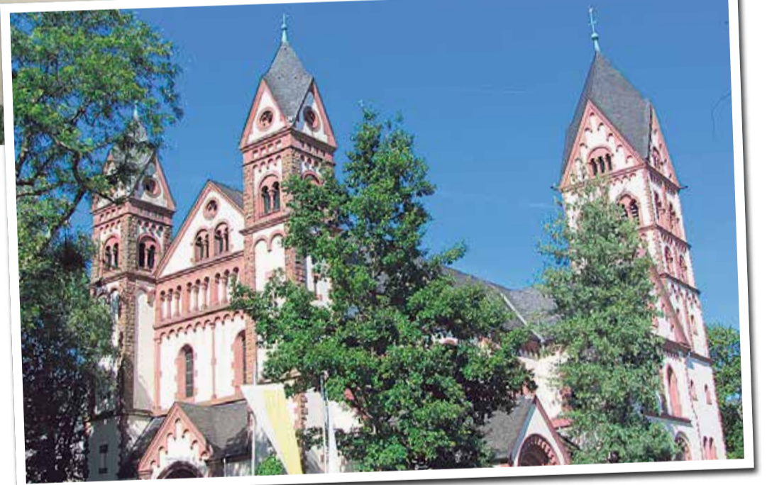
Die katholische St. Josephskirche