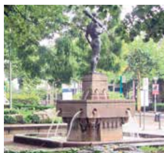
Weißer Stein Brunnen

Frankfurt und Eschersheim haben bereits seit langer Zeit gute Verkehrsverbindungen. Schon 1877 gab es eine Haltestelle der Main-Weser-Bahn mitten in Eschersheim. Ab 1888 konnten die Eschersheimer mit einer Pferdetrabahn nach Frankfurt fahren, auf der damals noch un bebauten