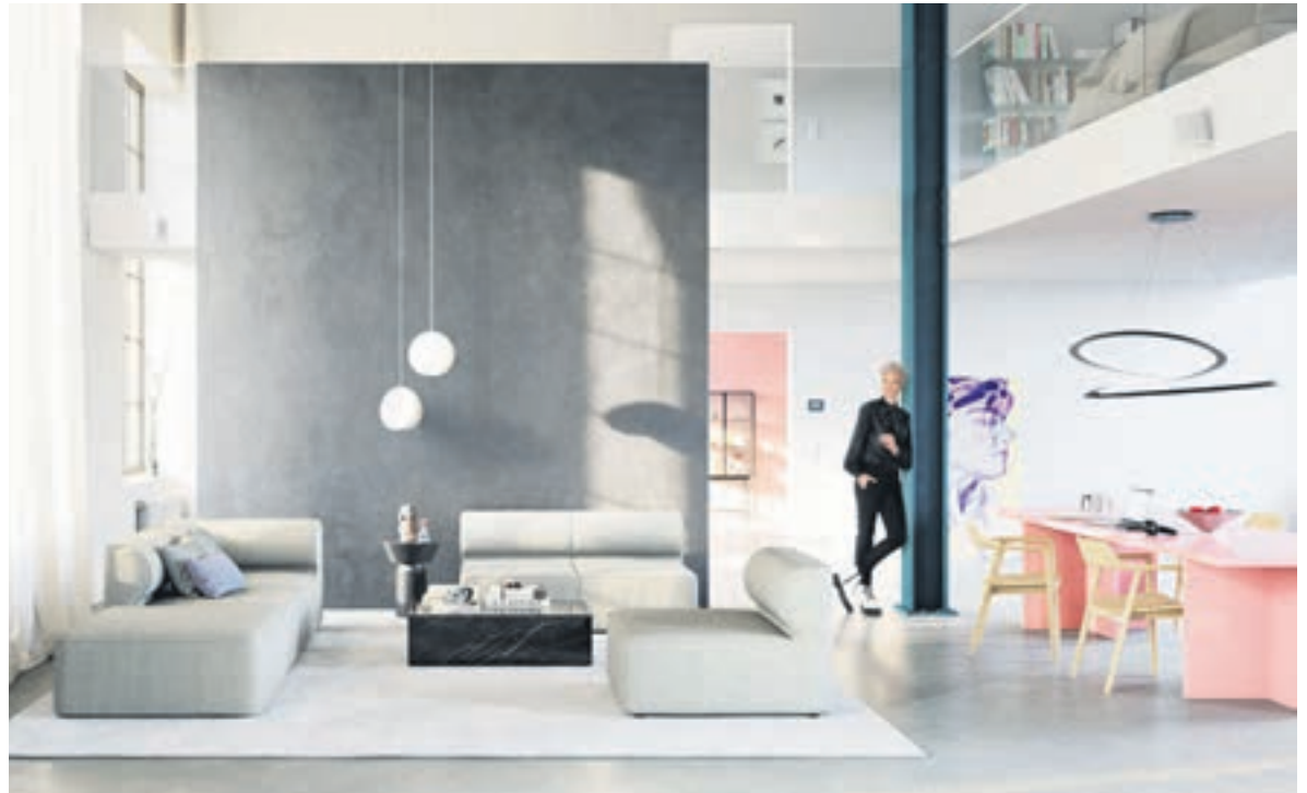
Lust auf mehr Großzügigkeit: Loftartige Räume verwöhnen die Bewohner mit viel Platz und gleichzeitig viel Behaglichkeit.

(DJD-K). Mit ihrer Großzügigkeit und dem industriell-urigen Charme stehen Lofts hoch im Kurs, wenn es um das moderne, urbane Wohnen geht. Allerdings kommt es angesichts der Größe besonders auf eine stimmige Raumgestaltung an. Wie das geht, zeigt dieses Beispiel einer ehemaligen Tabakfabrik. Dank unterschiedlicher Farbakzente und Kreativtechniken für die Wände hat das Loft eine klare Gliederung erhalten. Ein Malerfachbetrieb hat schon in der Planungsphase beraten und kreative Ideen vorgeschlagen. Dank der professionellen Ausführung des Malerbetriebs mit hochwertigen Produkten wie von Brillux entstand ein einladendes Loft mit offenem Wohnkonzept. Mehr Inspirationen gibt es etwa unter www.brillux.de/zuhause . Hier sind ebenfalls passende Kontakte von Fachhandwerkern vor Ort zu finden.