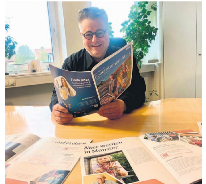
Bürgermeister Joachim Schledt stößt im neuen Generationen-Atlas für Münster. Inhalte und Fotos sind individuell auf Münster zugeschnitten.

Generationen-Atlas: Münsters Wegweiser für Klein bis Groß