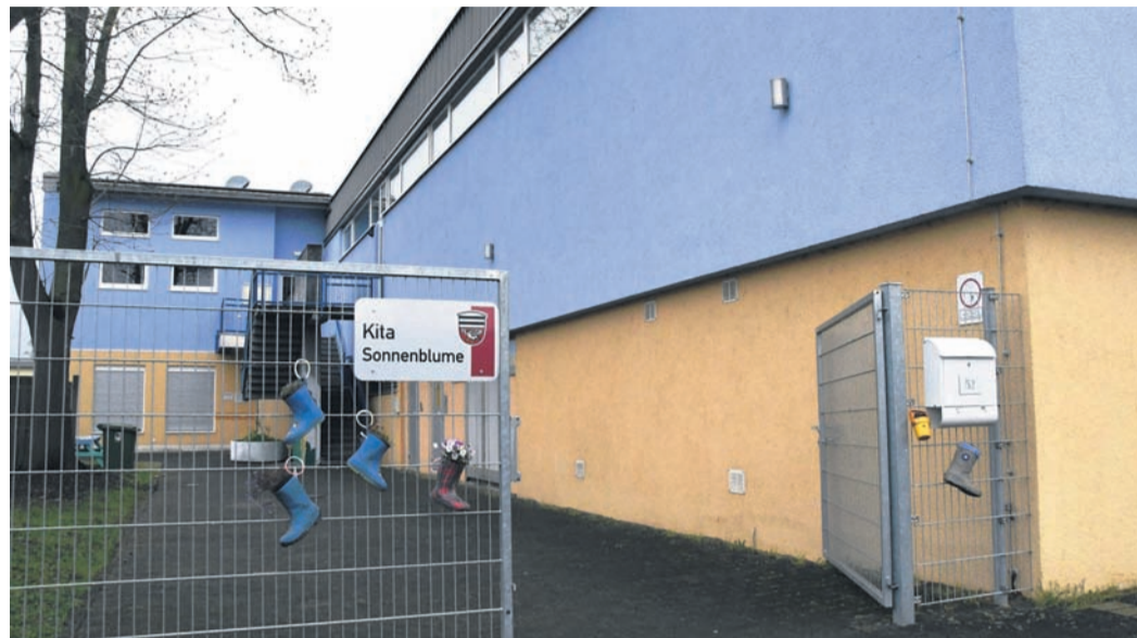
Ein Teil des Münsterer Hallenbads wird derzeit von der Kita „Sonnenblume“ genutzt.