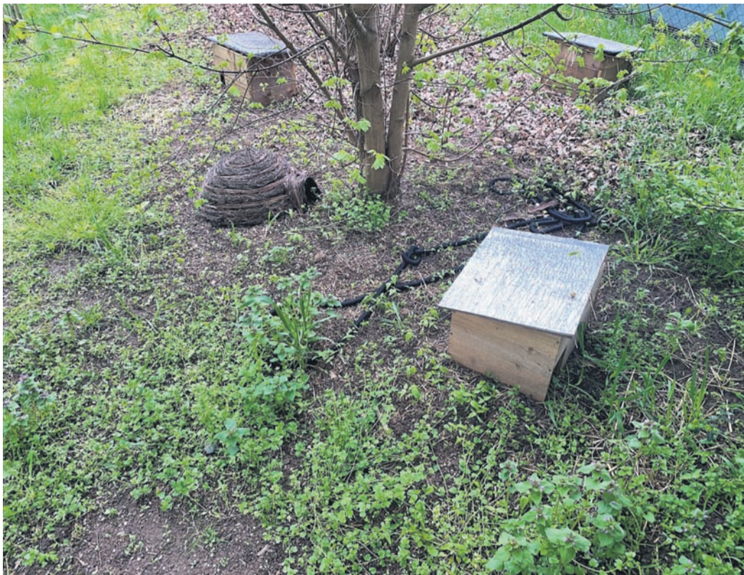
Auf einigen Bereichen entlang des Helgolandrings in Münster sind in den letzten Tagen Igelhäuschen und andere Tierfutterstationen aufgestellt worden.

Man startet am Freitag, 28. April, mit dem Kleinbus um 10.30 Uhr, Am Wiesengrund 14 in das „5-Sterne Ringhotel Siegfriedbrunnen“ nach Grasellenbach im Odenwald, ein Platz ist noch zu vergeben. Nach der Neueröffnung des alten Stammlokal „Tre Sorelle“ in Altheim, trifft man sich dort wieder jeweils am letzten Donnerstag im Monat. Das nächste Treffen ist am 25. Mai ab 18.15 Uhr.