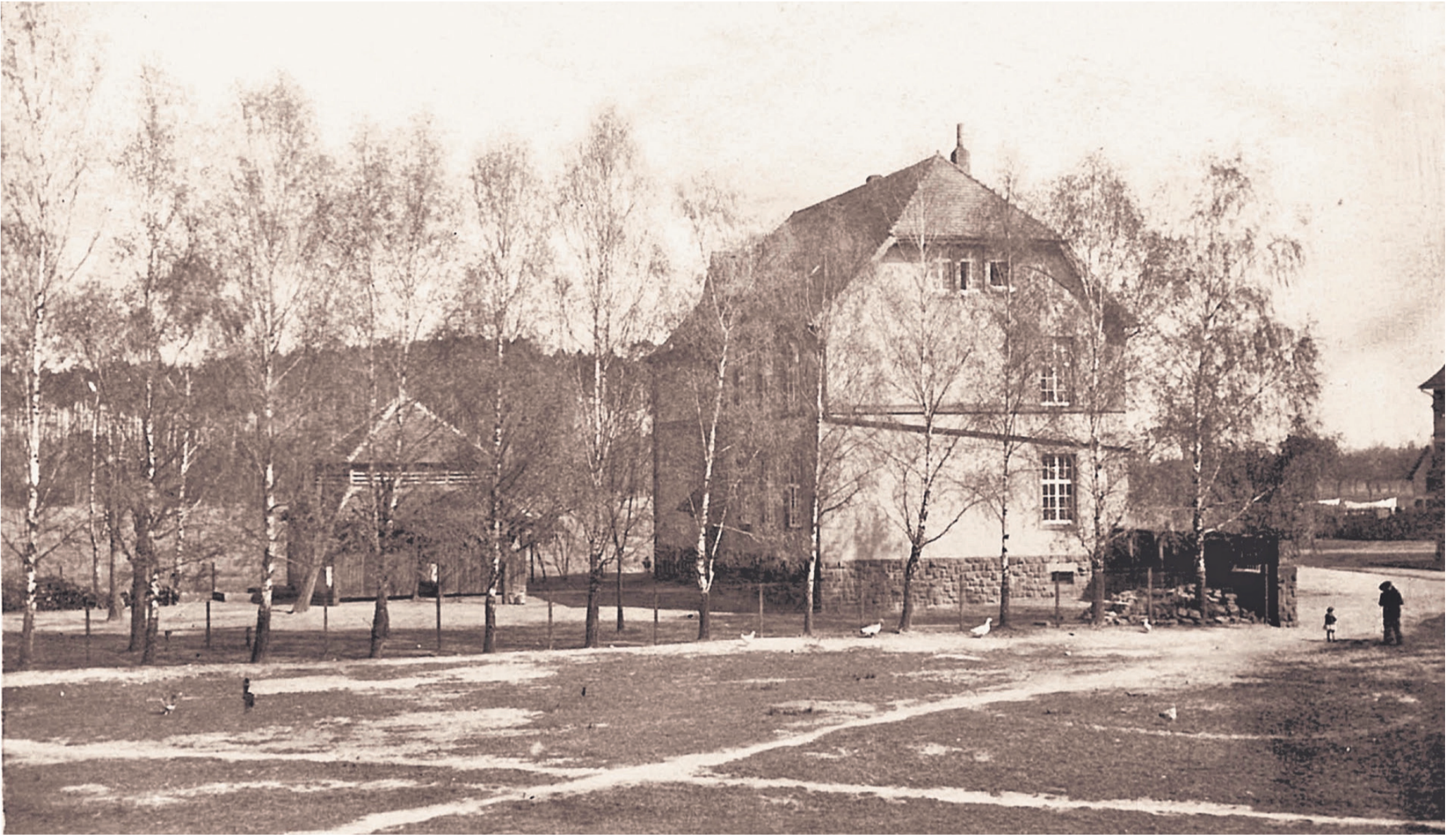
Aktuelles Kalenderblatt von „Unser Obertshausen 2023“.

Unabhängige Wochenzeitung und Nachrichten aus und für Obertshausen