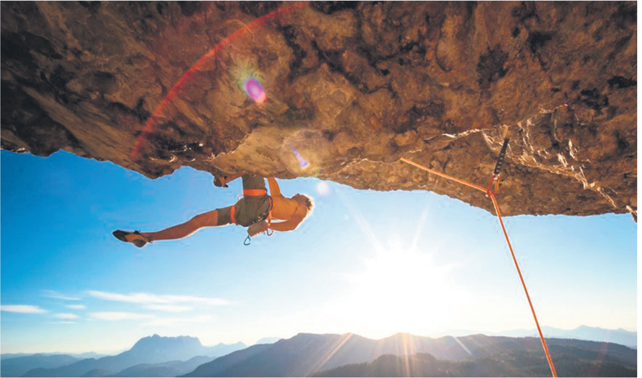
Fellsportler kommen im PillerseeTal auf ihre Kosten.