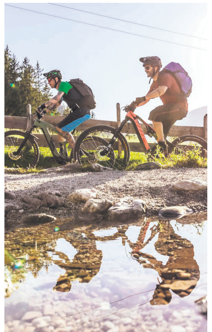
Über 400 Kilometer Rad- und Mountainbike-Routen durchqueren das PillerseeTal und die Umgebung.