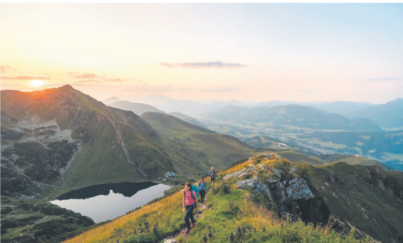
Die zahlreichen Wanderwege führen Aktivurlauber zu den schönsten Gipfeln und Aussichtspunkten der Region

Ein Tipp: Autofrei ins PillerseeTal, alle Infos dazu gibt es unter www.autofrei.tirol . Alle Infos zur Region findet man unter www.pillerseetal.at .