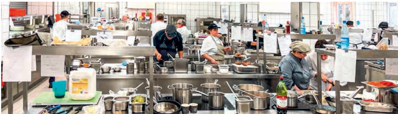
Konzentriert verwirklichten die hier noch angehenden Köche und Köchinnen ihre Menü-Ideen für die praktische Abschlussprüfung.

Das Unternehmen Aramark geht einen besonderen Weg der Fachkräftesicherung: „Von der Küchenhilfe zum Koch“ ist ein 18-monatiges Programm, mit dem Mitarbeiterinnen und Mitarbeiter des Anbieters für Catering und Servicemanagement mit Sitz in Neu-Isenburg einen Berufsabschluss erwerben können.