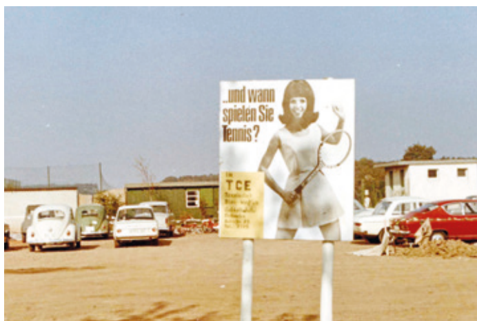
Zeitgeist-Werbung in den 70er-Jahren für den noch jungen Tennisclub.