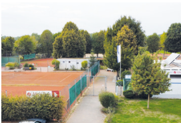
Heute spricht die weitläufige Anlage mit bald zehn Plätzen für sich.

(Erzhausen, TCE) „... und wann spielen Sie Tennis?“ fragte in den 70er-Jahren ein Plakat vor dem Clubgelände des Tennisclubs Blau-Weiß Erzhausen. Wer heute herausfinden möchte, ob Tennis etwas für sie oder ihn wäre, könnte die Antwort an diesem Samstag, 29. April, beim