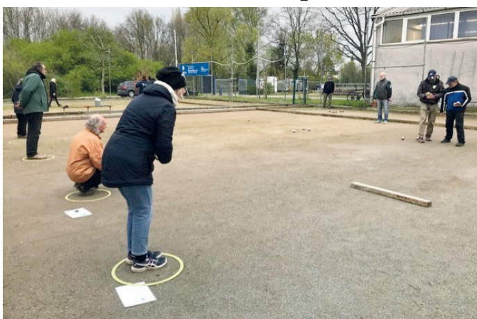
Laminierte Übungsanweisungen säumen präparierte Bahnen: Bei den Legeübungen gilt es grundsätzlich, die Kugel möglichst nah an die Zielkugel (Sau) zu platzieren. Da kann schon mal was dazwischenkommen – z.B. ein Balken, der mit einem „Hochportée“ überwunden werden muss.

(kt) Am 20.04. startete die erste der zehn Trainingseinheiten zur Vorbereitung auf das Boule-Sportabzeichen. Bei grauem Himmel fanden sich trotzdem über 20 SGA-Spieler und einige angemeldete Gäste auf dem SGA-Boulegelände ein, um die sechs Lege- und Schießübungen einzustudieren. Gar nicht so einfach, fanden selbst versierte Spieler. Denn wie schnell ist eine Kugel „durchgelegt“ und wie selten gelingt beim Schießen ein „Au-fer-Schuss“.