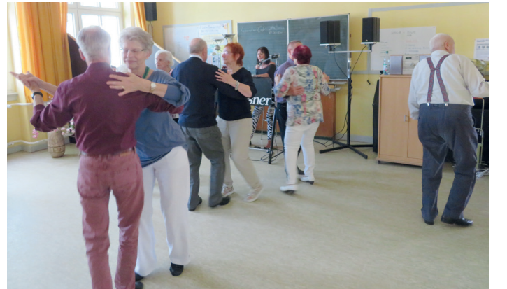
Beschwingt beim Maitanz 2022.