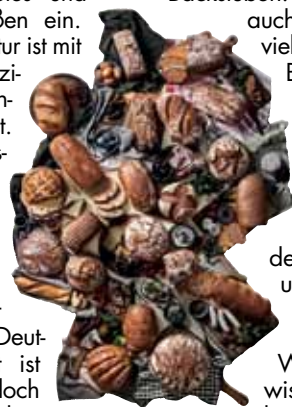
Das Foto zeigt eine große Auswahl an verschiedenen Broten und Gebäckarten, die kunstvoll auf einem Holztisch angeordnet sind.

Tausende Handwerksbäcker ihre Kunden mit speziellen Angeboten und geben Einblicke in ihre Backstuben. Sie zeigen dabei auch, wie spannend und vielfältig die Jobs im Bäckerhandwerk sind. Das Bäckerhandwerk ist schließlich eine Branche mit Leidenschaft und voller Genussmomente. Entdecken Sie in den sozialen Medien unter #TagdesBrot und bei Instagram @innungsbaecker die Welt des Backens mit wissenswerten Infos und kreativer Inspiration. Den nächsten Innungsbäcker in der Nähe findet man ganz leicht unter www.baeckerfinder.de oder in der kostenlosen App Bäckerfinder.