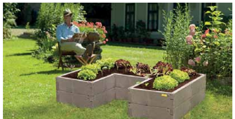
Ein Hochbeet aus Kunststoff macht keine Arbeit, denn das Material ist robust und langlebig. Da kann man ganz entspannt dem Gemüse beim Wachsen zuschauen.

Kunststoff scheint eher ungewöhnlich für ein Hochbeet, ist aber eine clevere Wahl. Der Hersteller Juwel etwa geht mit seinem Hochbeet Timber Ergoline ganz neue Wege. Aus witterungsbeständigen, wärmespeichernden und vollständig recycelbaren Elementen lässt sich das Beet individuell aufstellen. Der Clou: Die Bauteile sind in Winkeln geformt, für Beete, bei denen der Gärtner im Mittelpunkt steht und problemlos auch die hintersten Radieschen erreichen kann. Außerdem hat Timber Ergoline zwar den Look von Holz, muss aber nicht gestrichen werden und rottet auch nicht. Mehr Informationen gibt es auf www.juwel.com .