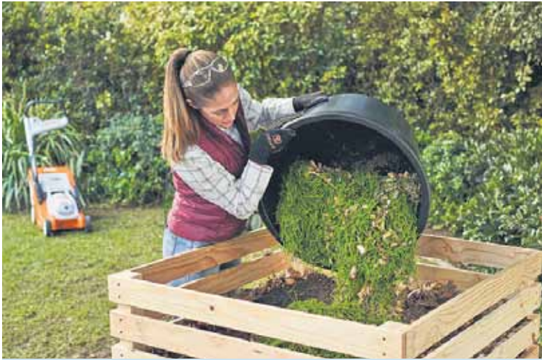
Perfekt für den Kompost: Der Rasenschnitt lässt sich als Nährstoffspender nutzen.