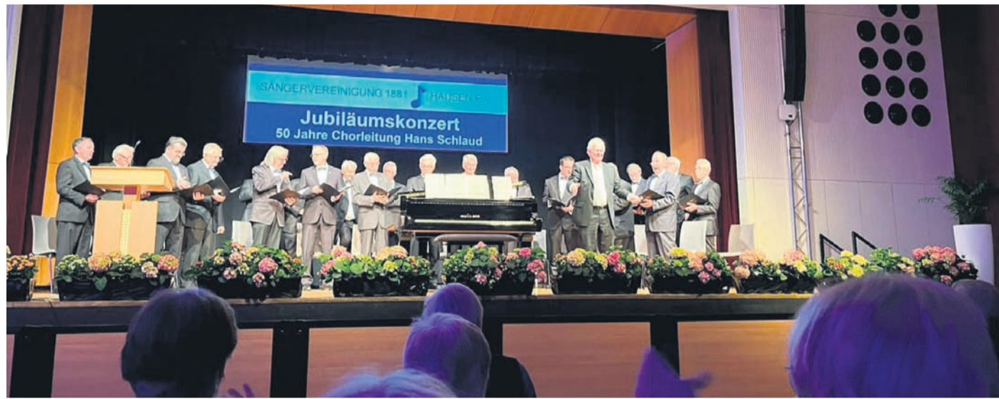
Am Ende des Konzerts gab es stehende Ovationen.

Im ersten Programmteil kamen Werke von Franz Schubert und Chöre aus Oper und Operette zum Vortrag. Den Auftakt bildete „die Nacht“ und „Nachtgesang im Walde“ von Franz Schubert. Danach erklangen Lieder „Chor der Schmiedegesellen“ von Albert Lortzing und der „Chor der Jäger“ von Carl Maria von Weber, es folgte der „Chor der Priester“ von