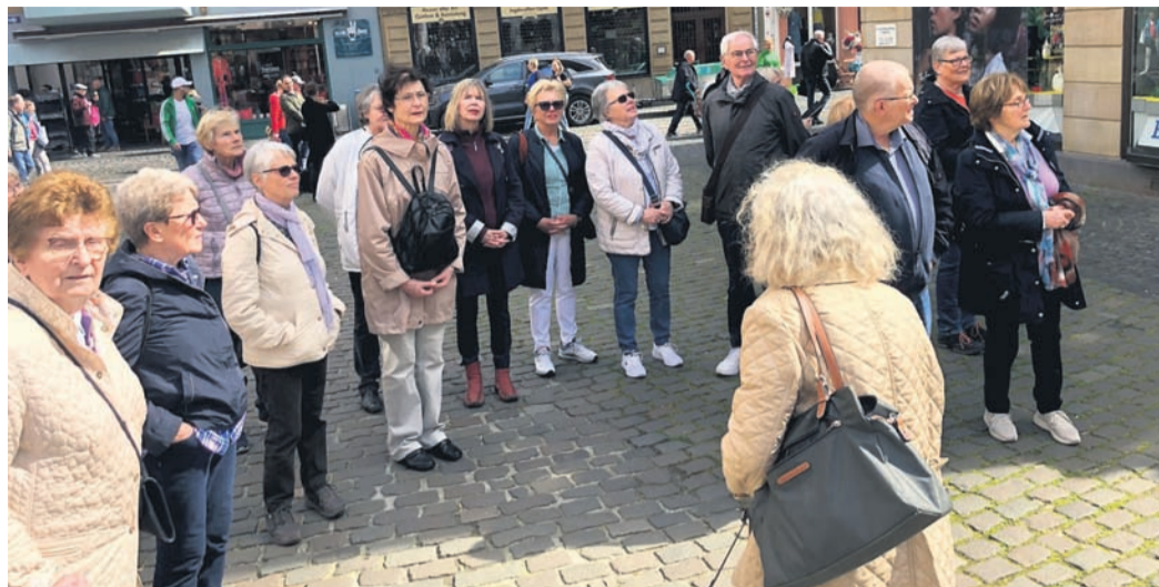
Die Naturfreunde bei der Stadtführung.