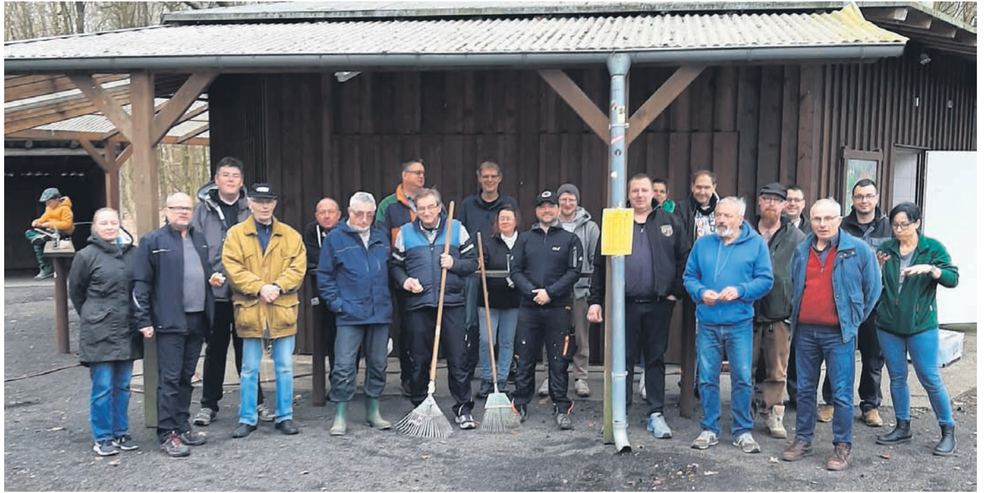
25 Vereinsvertreter halfen die Waldfreizeitanlage zu reinigen.