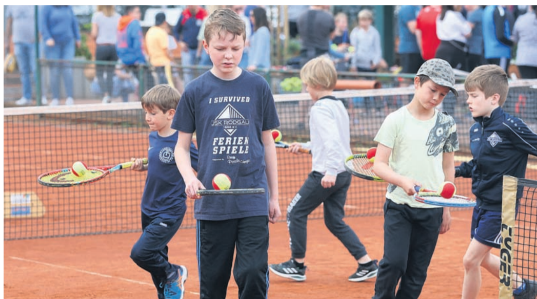
Tennis-Begeisterte aller Altersklassen hatten beim Aktionstag des TC Jügesheim zum Start der Freiluftsaion ihren Spaß.

Verschiedene Altersklassen waren auch beim Kennenlern-Tag für Tennisinteressierte mit dabei. Unter Anleitung des erfahrenen Trainerteams mit