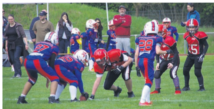
Archivbild vom letzten Jahr.

48 Jugendmannschaften der G- bis E-Jugend spielen Fußball um Pokale und Medaillen, dazu kommen acht Mädchenmannschaften. Die U-13 Fußballer der Rodgau Pioneers haben sich vier weitere Teams aus Hessen zu einem Turnier „jeder gegen jeden“ eingeladen. Die Volleyballabteilung veranstaltet ihr schon traditionelles „Anbaggern“. Jeder ist eingeladen auf der neuen 3-Feld-Beachvolleyball-Anlage in gemischten Mannschaften mitzumachen.