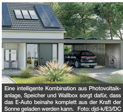
Eine intelligente Kombination aus Photovoltaikanlage, Speicher und Wallbox sorgt dafür, dass das E-Auto beinahe komplett aus der Kraft der Sonne geladen werden kann.

Eine weitgehend solare E-Mobilität kann die Emissionen beinahe auf null bringen