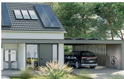
Eine intelligente Kombination aus Photovoltaikanlage, Speicher und Wallbox sorgt dafür, dass das E-Auto beinahe komplett aus der Kraft der Sonne geladen werden kann.

Eine weitgehend solare E-Mobilität kann die Emissionen beinahe auf null bringen