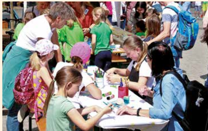
Auch Malaktionen waren beim Kinderfest im letzten Jahr sehr beliebt.

Stattdessen steigt das 16. Kinderfest auf dem weitläufigen Gelände der Martin-Niemöller-Schule. Der Ort ist in diesem Jahr ein anderer, aber nicht die Intention: Die vielen Helferinnen und Helfer wollen mit ihrem ehrenamtlichen Einsatz den Riedstädter Kindern ein tolles Erlebnis schaffen und sie zumindest für einen Nachmittag in den Mittelpunkt des Stadtgeschehens rücken. Wie immer wird es viel zu entdecken und zum Mitmachen geben. Da kann mit Tretauto oder Fahrrad ein Parcours absolviert oder sich beim Riesenkicker versucht werden. Sowohl für die ganz Kleinen wie auch für die schon größeren Kinder gibt es diverse Geschicklichkeits- und Bewegungsspiele. Natürlich kann auch gebastelt oder gemalt werden. Zum Toben und Hüpfen steht wieder die Hüpfburg bereit.