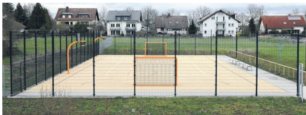
Zwei Tore, zwei Körbe: Der Bolzplatz an der Aue-Schule darf von der Münsterer Jugend ab sofort auch abseits der Schulzeit genutzt werden.