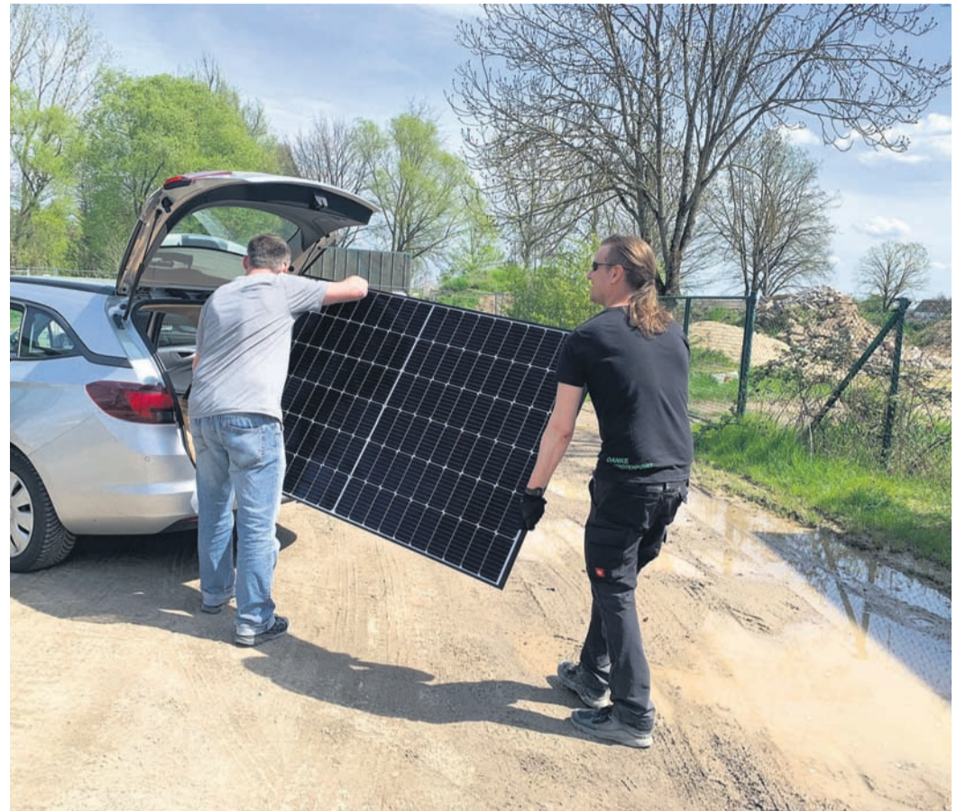
Die ersten 65 Kundinnen und Kunden der ersten Sammelbestellung im November 2022 konnten am 22. April ihre Solarmodule in Empfang nehmen.

Sonnenaufgang für die erste Bestellrunde „Balkonkraftwerke“