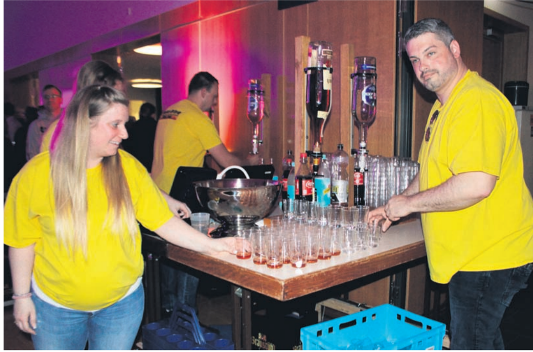
Das Helferteam, wie hier am Hütchenstand, war stets konzentriert bei der Arbeit.

Dass die lokalen Blauröcke als Organisator auftreten, ist jungen Feuerwehrkräften zu verdanken, die einst die Idee hatten, eine Mai-Feier für Junge und Junggebliebene anzubieten. Schon gleich zur Premiere wurden die Macher überrannt. Jürgen Müller, der ehemalige