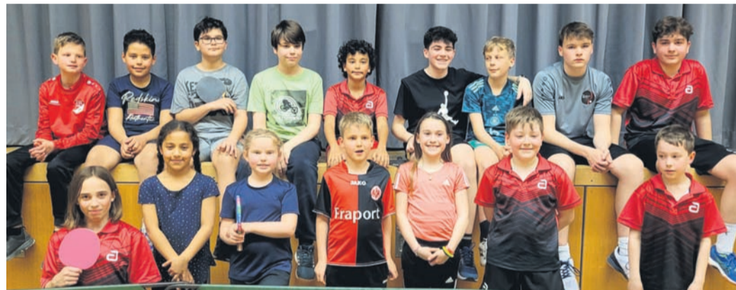
Die Teilnehmenden der Jugendvereinsmeisterschaften.